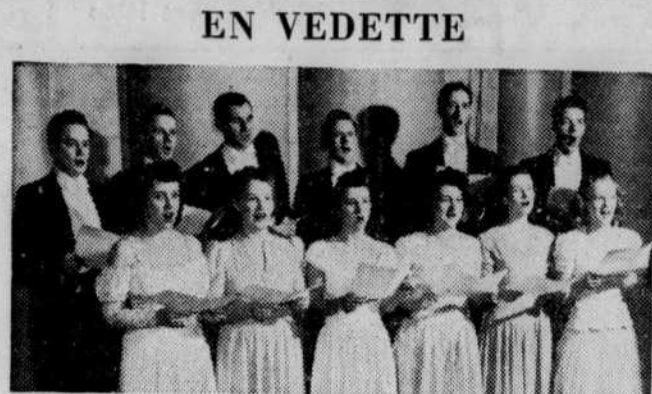
Le chœur Northern Electric répétant pour l'émission de Noël de l'heure Northern Electric. Ce programme sera entendu le lundi soir (23 décembre) sur les ondes des réseaux français de Radio-Canada...