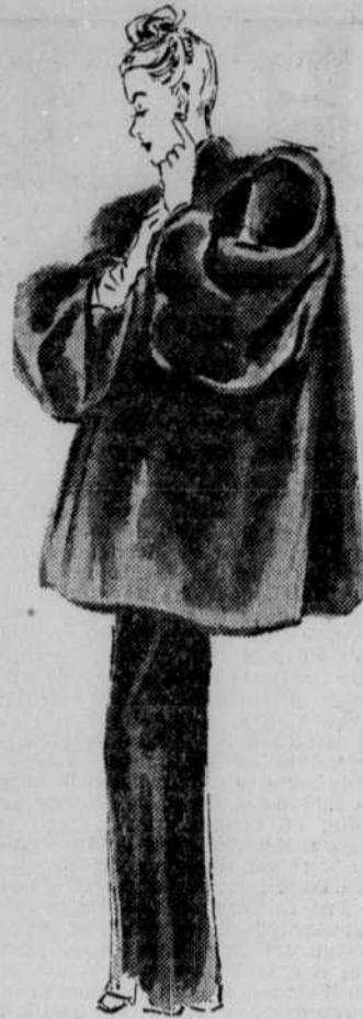
Bonmouton fait des jaquettes qui ont fort grand air et peuvent même accompagner la robe du soir.

Généreusement, faites parvenir vos envois à 445 rue St-François-Xavier, Montréal, P.Q. Pour l'achat d'un jouet: 50c, pour l'achat d'un diner 85. Toute contribution, si modeste soit-elle, sera reçue avec reconnaissance.