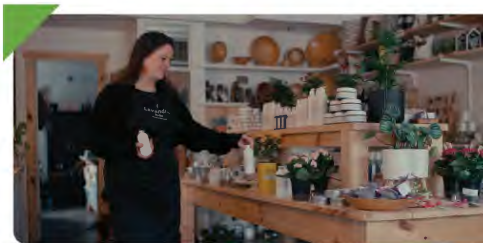
Lavandine et Cie, Montebello