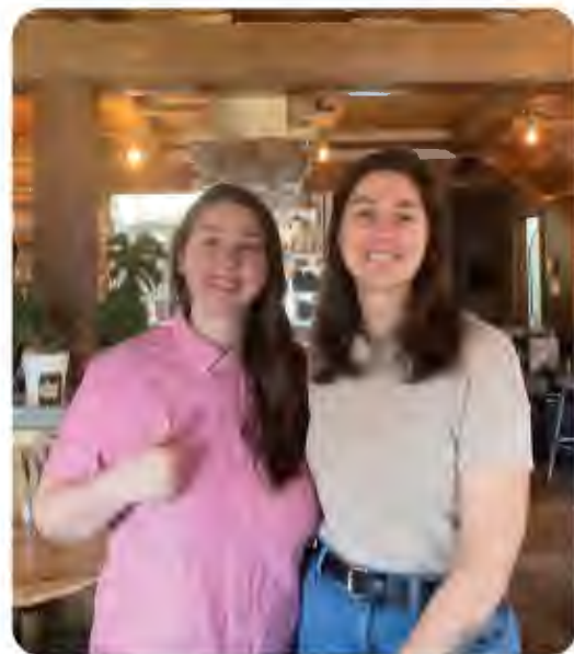
À Outrance, Gatineau

De nombreuses entreprises seront à vendre au cours des prochaines années. Afin de faciliter le processus de transfert, la SADC a mis en place un service facilitant le maillage entre cédants et repreneur. Nos listes d'acheteur et vendeur nous permettent donc de mettre en relation des cédants et repreneurs qui ont des intérêts communs. Également grâce à ce service, la SADC conseille, oriente et réfère autant les acheteurs que les vendeurs. Les prêts offerts par la SADC peuvent également contribuer à la transaction. L'entreprise A Outrance a bénéficié des services de la SADC.