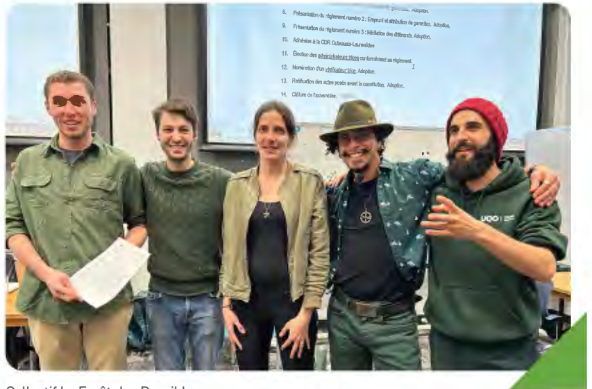
Collectif La Forêt des Possible

La SADC accompagne les entreprises et les groupes d'entrepreneurs désireux de mettre en place des initiatives structurantes pour le développement économique du territoire et l'amélioration de la qualité de vie locale. Nous avons soutenu quatre jeunes travailleurs autonomes passionnés dans la création de l'organisation à but non lucratif "La Forêt des possibles". Cette OBNL vise à promouvoir la valorisation du bois, l'économie circulaire, et l'art local au sein de la communauté. Nous avons accompagné le collectif dès la phase de conception, aidant à définir clairement la vision et les objectifs de l'organisation. Nous avons aidé à élaborer le plan d'affaires, essentiel pour structurer les activités et attirer les financements nécessaires. En outre, nous avons fourni des références de contacts pertinents, facilitant ainsi les premiers pas de l'OBNL dans son réseau et ses démarches initiales. Cette collaboration a permis de poser les bases d'un projet innovant et engagé, visant à repenser l'interaction de la communauté avec ses ressources forestières et artistiques.