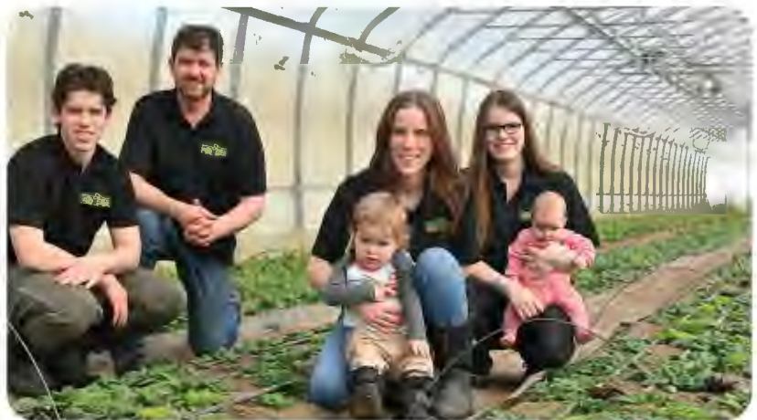
Ferme aux pleines saveurs, Saint-André-Avelin

En investissant dans les honoraires professionnels nécessaires pour mener à bien ce mandat, la SADC apporte un soutien précieux pour la réalisation de cette initiative qui renforce le développement de cette entreprise en ayant un impact concret sur sa rentabilité en diminuant ainsi ses coûts d'opérations, sur son impact environnemental en diminuant sa consommation de ressources et sur l'image de l'entreprise comme acteur engagé et orienté vers l'avenir.