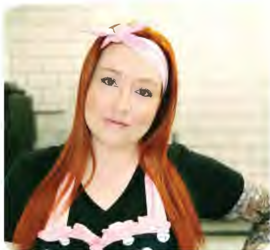
Miss Macaron, Chénéville