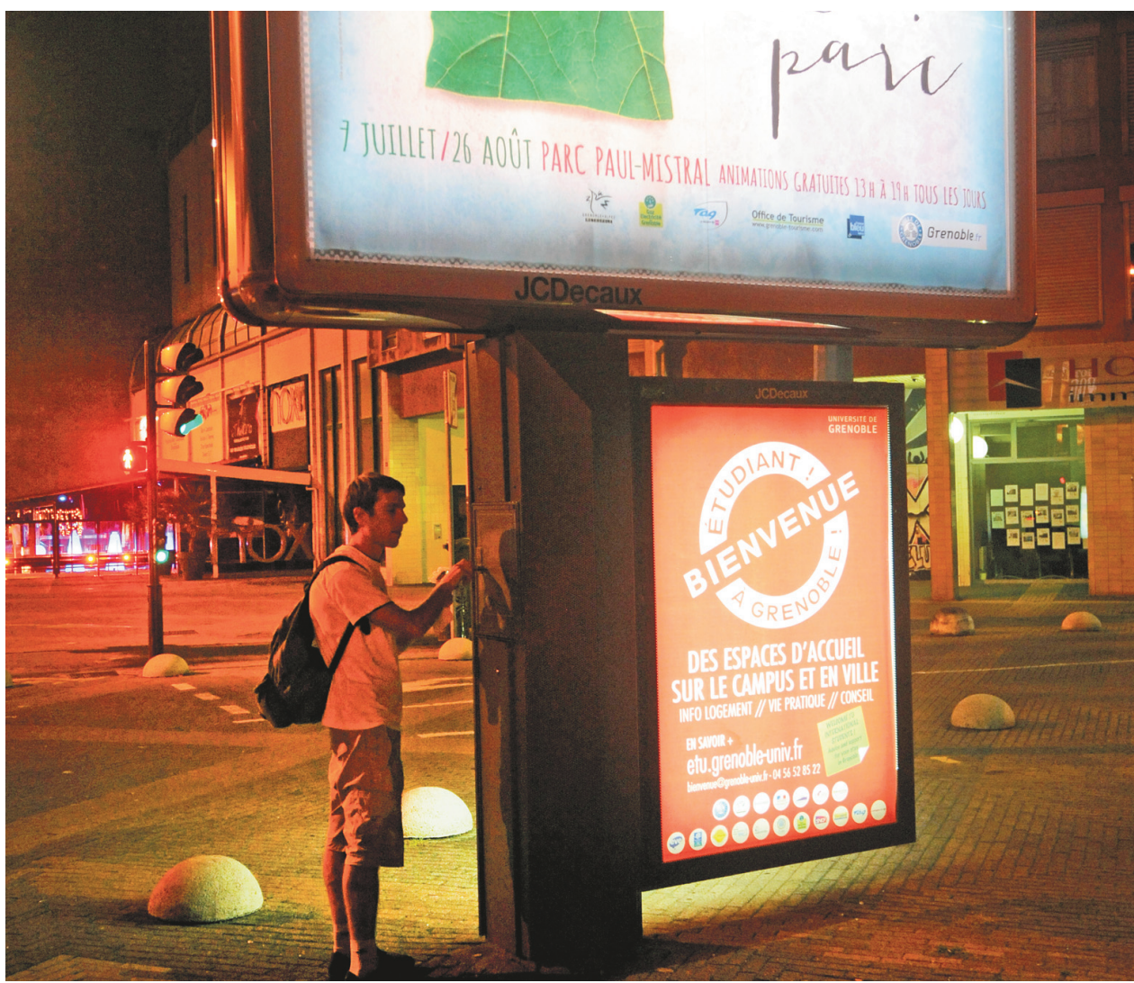
La Ville a mis fin à son contrat avec le géant français JCDecaux.