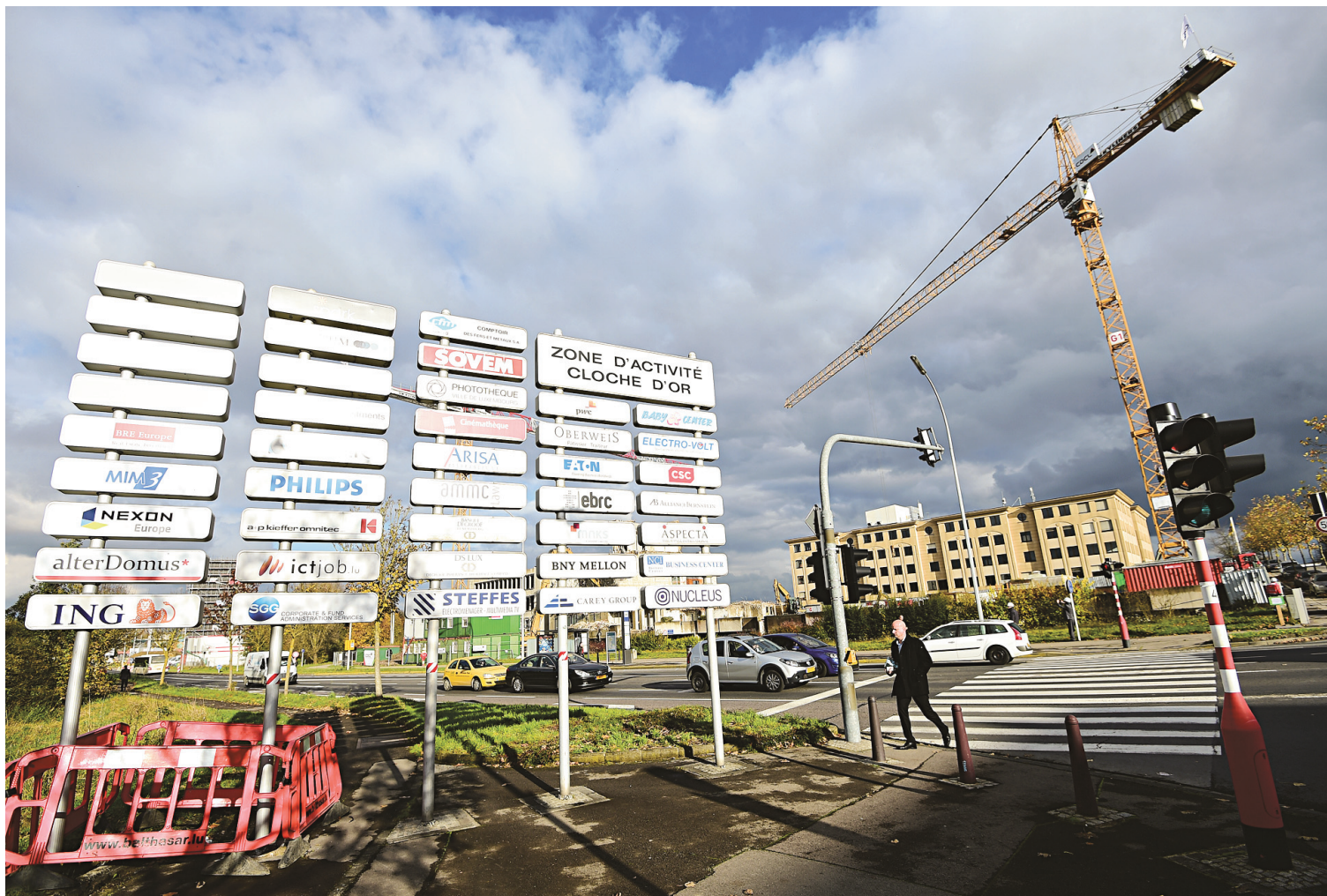
La zone financière du Luxembourg est le théâtre d'un scandale depuis novembre.

Les documents confidentiels révélés récemment dans l'affaire