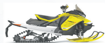
MXZ® X® 850 E-TEC®