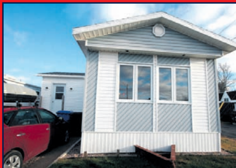
11, rue Marcellin, FORESTVILLE