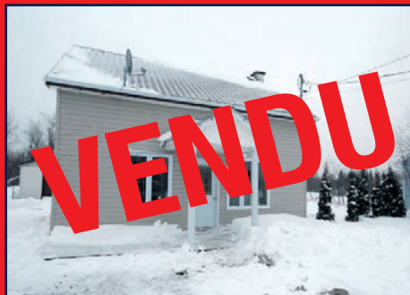
29, rue Coté, LONGUE-RIVE