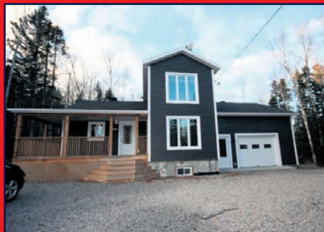
357, chemin de l'Anse-à-Pierrot, SACRÉ-CŒUR