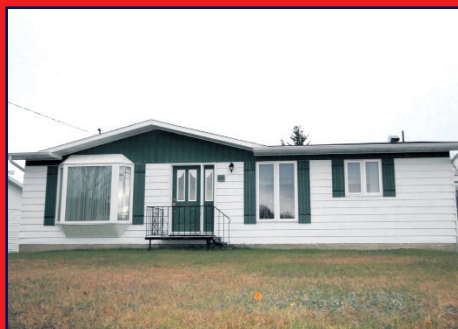
103, route Forestière, LES ESCOUMINS