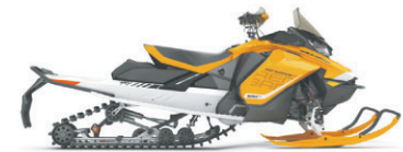
RENEGADE® X 850 E-TEC