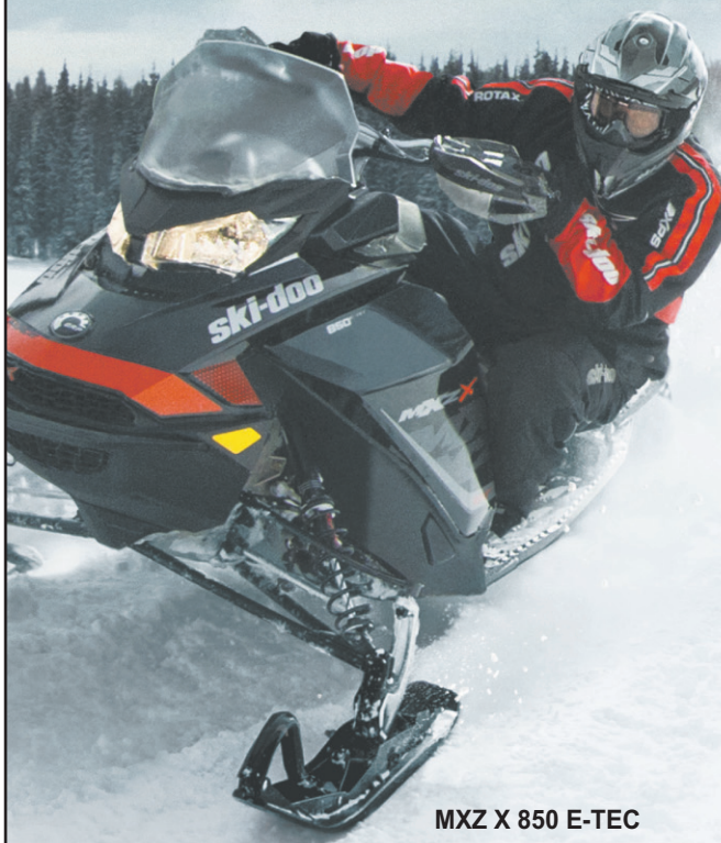
MXZ X 850 E-TEC

Le nouveau moteur Rotax® 850 E-TEC, le moteur 2 temps le plus puissant de l'industrie*. La plateforme REV® de nouvelle génération avec position avancée révolutionnaire. Ensemble, ils deviennent la référence en matière de puissance et de précision, peu importe votre conduite ou votre terrain de jeu.