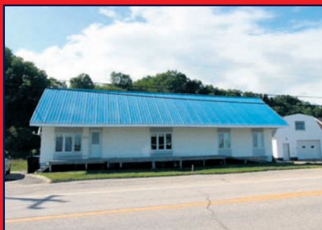
172, route 138, LONGUE-RIVE

Aucune idée. Je ne peux vraiment pas le dire parce que, comme je disais tantôt, avant que je prenne ma retraite, on m'avait dit que je devrais devenir maire et j'avais répondu : « jamais! » Alors, je pourrais répondre aujourd'hui « jamais », mais je pourrais faire un deuxième mandat!