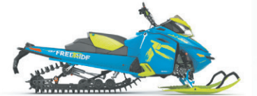
FREERIDE MC 137

Jusqu'à 40% sur les vêtements non courant en inventaire