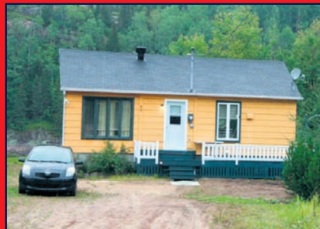
40, rue Laval, FORESTVILLE