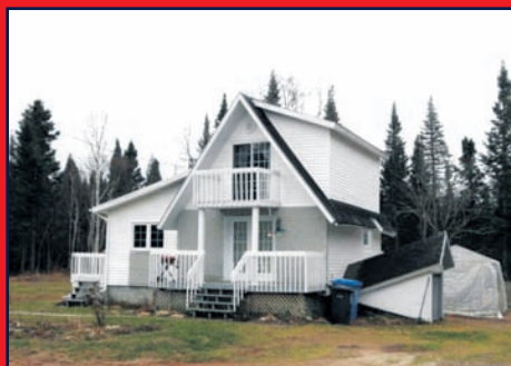
112, chemin des Îlets-Jérémie, COLOMBIER