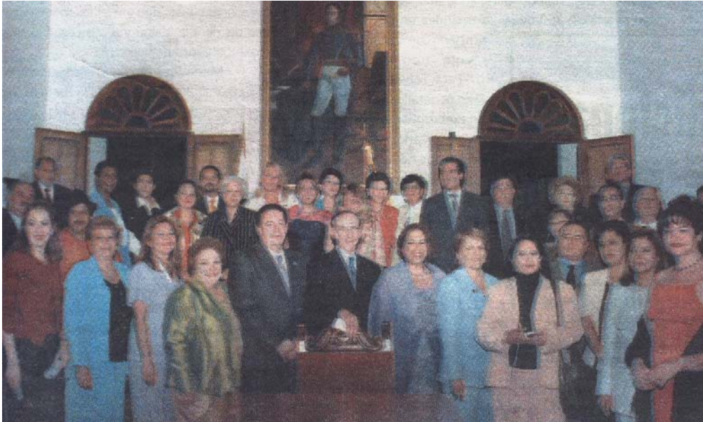
Des parlementaires lors de la séance de clôture.