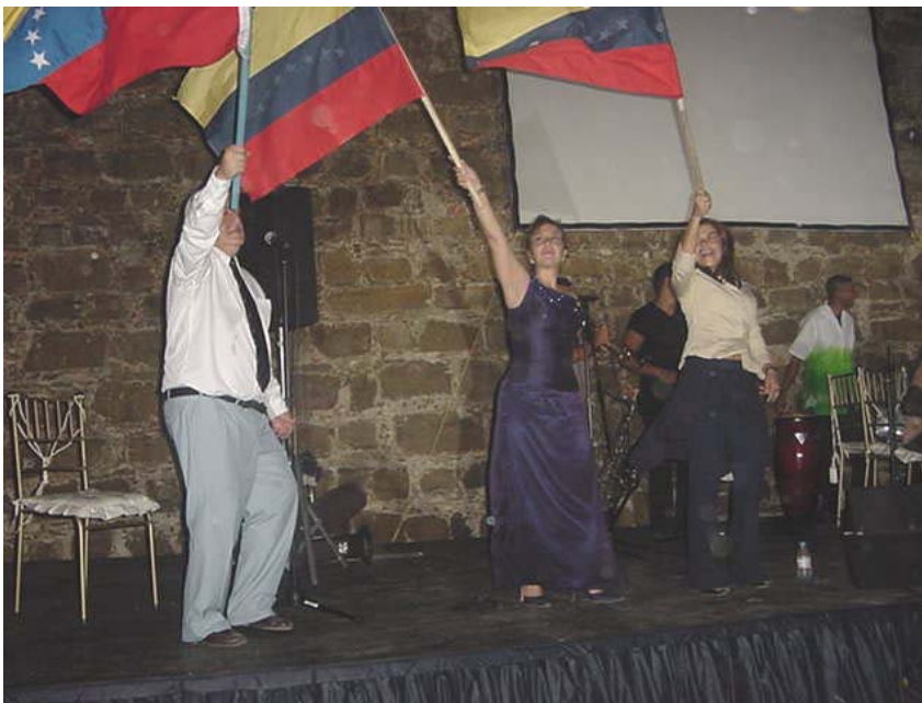
Moments de la fête vénézuélienne, organisée par le gouvernement de l'État de la Nueva Esparta et la Corporation touristique de la Nueva Esparta.