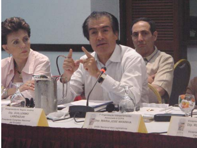
Le député Guillermo Landázuri, président du Congrès de l'Équateur et président de la Commission de la COPA sur la ZLEA