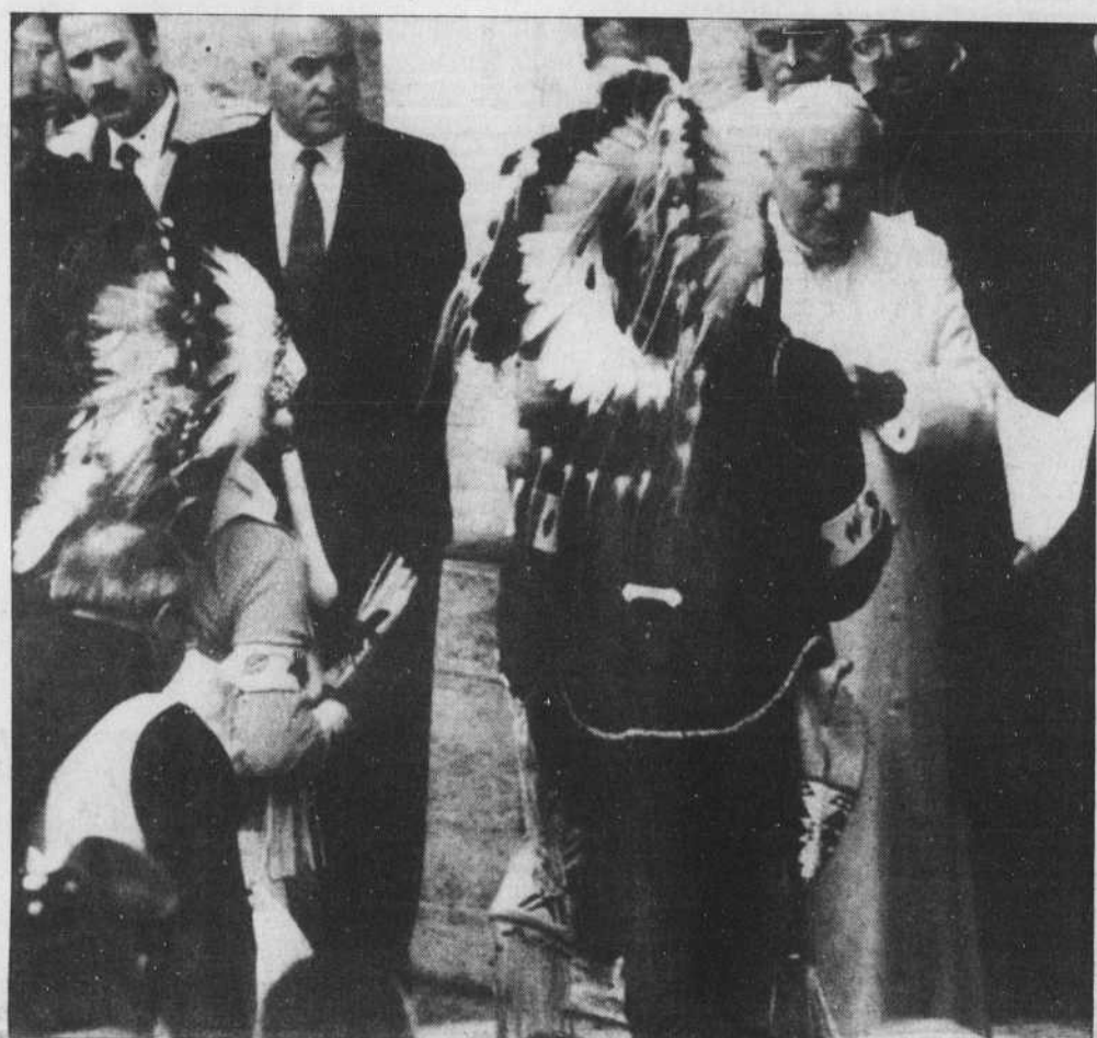
Le pape Jean-Paul II serre la main du chef indien Crow John Pretty, qui dirigeait hier une délégation américaine à la journée internationale pour la paix, à laquelle ont participé à Assise 200 représentants de 12 religions. L'appel à la trêve mondiale n'a en revanche pas connu le même succès même si des mouvements rebelles d'au moins 11 pays et trois gouvernements en guerre avaient promis de respecter la trêve. Au Liban notamment, des combats ont fait un mort. Autres informations en page 6.