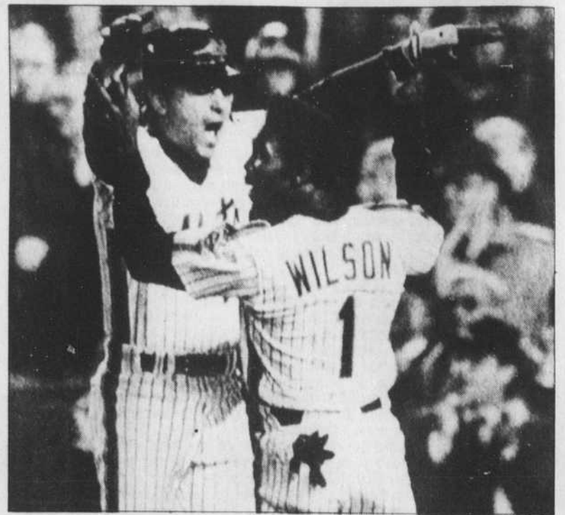
Lee Mazzilli et Mookie Wilson jubilent après avoir marqué les deux premiers points de Mets sur un simple de Keith Hernandez, à la 6e manche.

Après le retrait de Santana, le frappeur suppléant Lee Mazzilli a entamé la poussée avec un simple. Wilson a aussi frappé un simple. Visible-