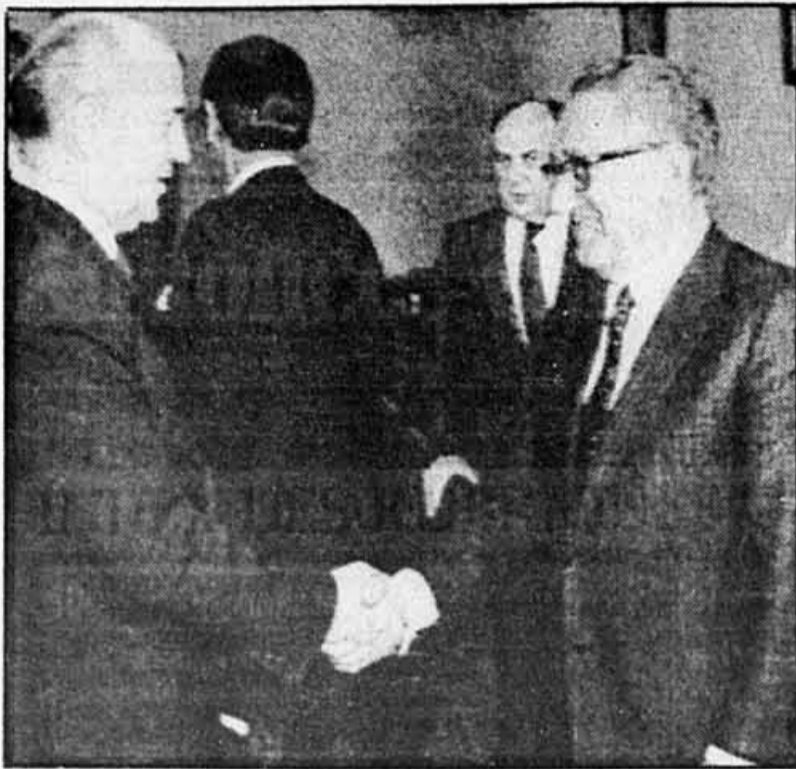
Mikhail Gorbatchev, à gauche, recevant l'ancien secrétaire d'Etat américain Henry Kissinger.