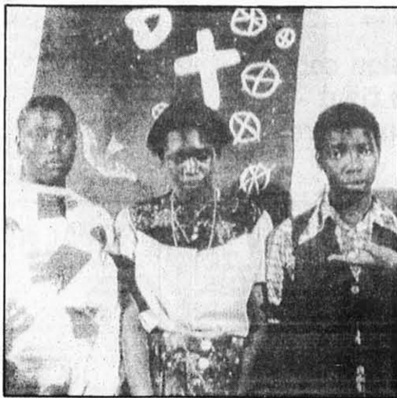
Ces trois adolescents, qui furent emprisonnés sous l'empire de l'état d'urgence, ont hier raconté leurs malheurs au cours d'une conférence de presse. Plus de 9 000 enfants de moins de 18 ans ont connu la captivité en Afrique du Sud.

Selon les chiffres compilés par le PFP et d'autres groupes de surveillance, entre 20 000 et 25 000 Sud-africains ont été détenus sous l'état d'urgence, dont environ 6 000 âgés de moins de 18 ans, a affirmé Mme Suzman.