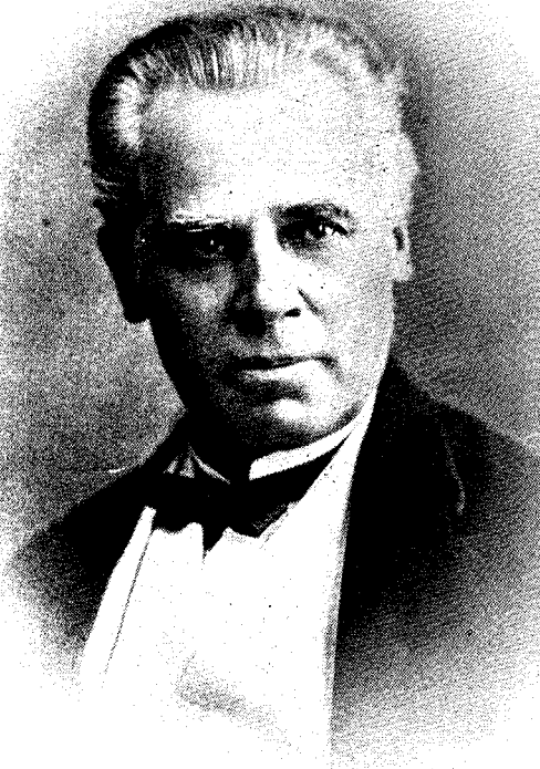
SIR GEORGE-ETIENNE CARTIER.