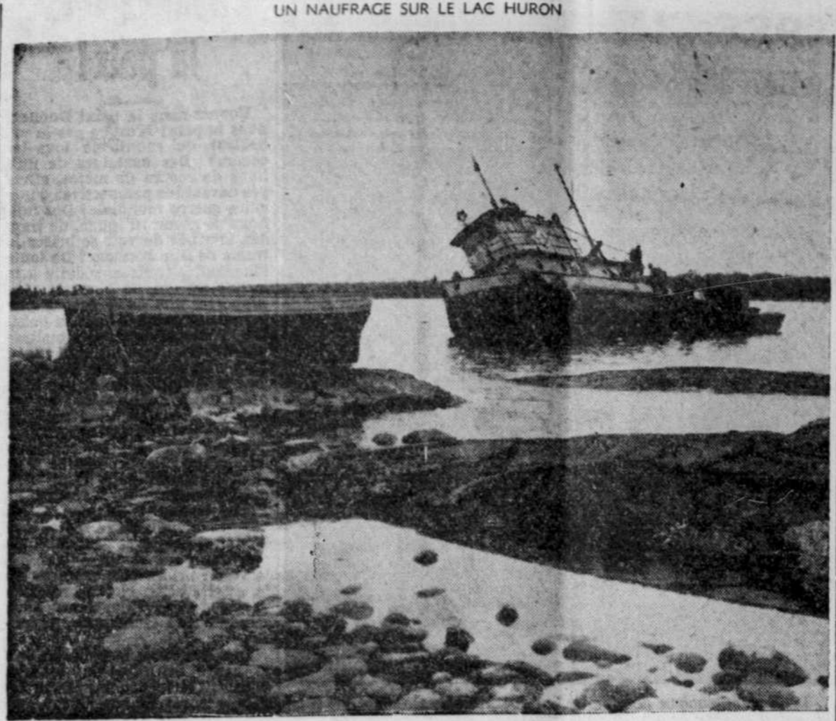
Les 16 matelots et officiers maritimes de la drague "Ella M." et du remorqueur "Patricia McQueen" ont dû passer dernièrement deux jours et trois nuits cramponnés aux débris de leurs navires qu'une violente tempête accompagnée de neige avaient poussés sur des rochers près de l'île Manioulin, dans le lac Huron. On voit ici à droite le remorqueur et à gauche une des chaloupes qui a permis aux marins de gagner la terre ferme une fois que se furent apaisées les vagues d'une hauteur de 15 pieds causées par la tempête.