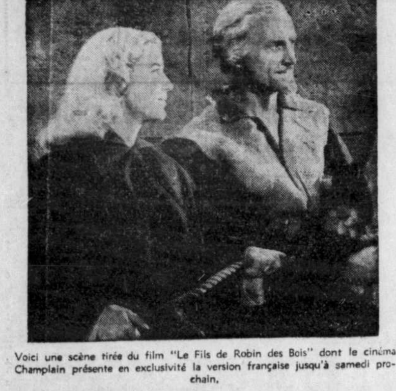
Voici une scène tirée du film "Le Fils de Robin des Bois" dont le cinéma Champlain présente en exclusivité la version française jusqu'à samedi prochain.