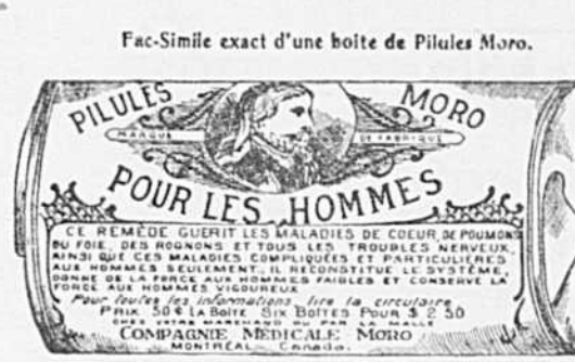
Fac-Simile exact d'une boîte de Pilules Moro. L'Étiquette est de papier blanc imprimé en bleu.