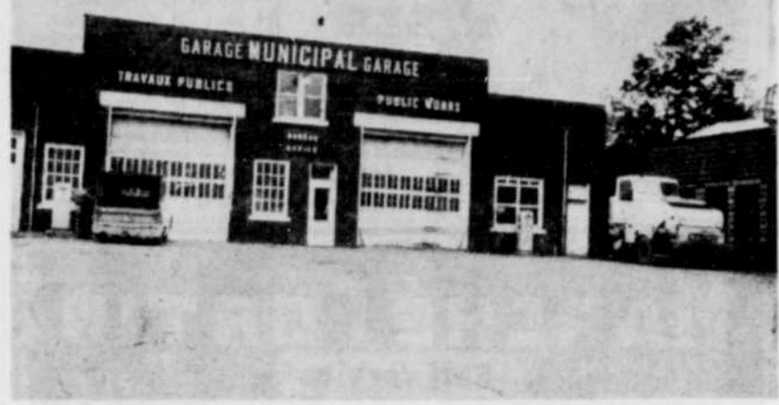
GARAGES MUNICIPAUX. — La cité de Granby possède actuellement des garages municipaux situés à l'arrière de l'hôtel de ville et qui sont devenus nettement inadéquats. On voit ci-haut, l'extérieur de l'un des garages que possède la cité et qui devraient, selon le conseil municipal, faire place à de nouvelles constructions dans un autre secteur de la ville.