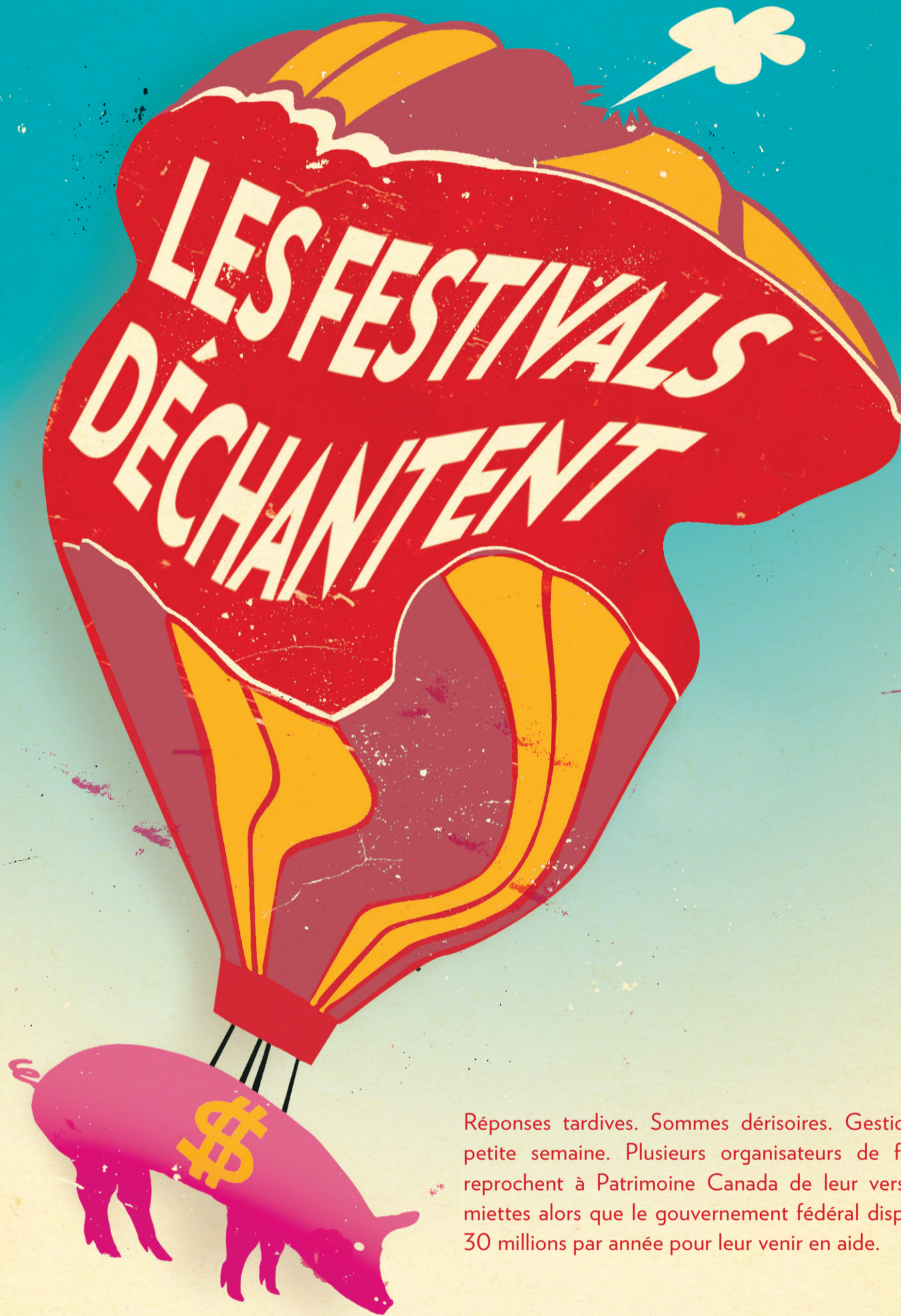
ILLUSTRATION FRANCIS LEVEILLÉE, LA PRESSE

Réponses tardives. Sommes dérisoires. Gestion à la petite semaine. Plusieurs organisateurs de festivals reprochent à Patrimoine Canada de leur verser des miettes alors que le gouvernement fédéral dispose de 30 millions par année pour leur venir en aide.