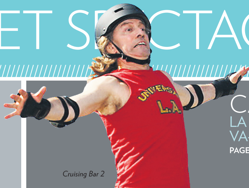
Cruising Bar 2