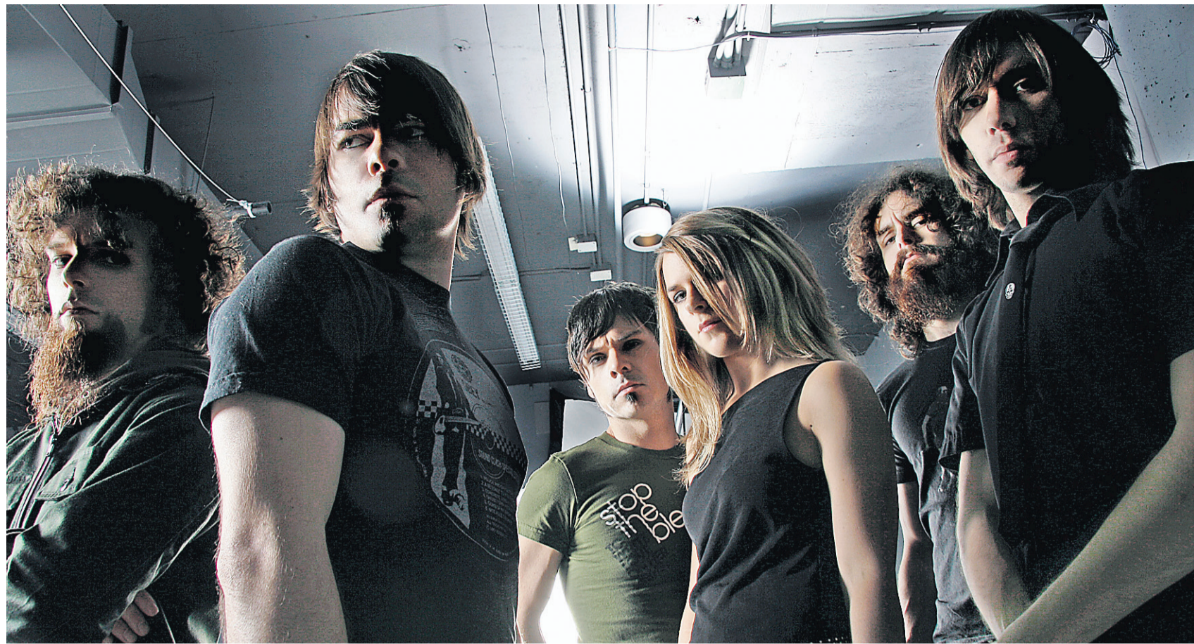
Les six membres du groupe Your Favorite Enemies vivent sous le même toit, à Varennes.

Un deuxième album est paru cet été. Love Is A Promise Whispering