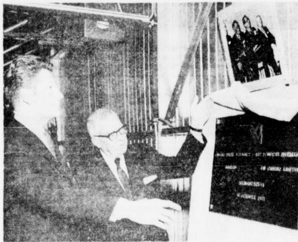
Plaque commémorative à l'usine Les Poudres Métalliques

Le nouveau chargé de groupe en éducation physique devra assurer la coordination des programmes, l'organisation des activités sportives et planifier, en collaboration avec l'équipe de professeurs, l'enseignement de l'éducation physique dans les écoles secondaires et élémentaires.