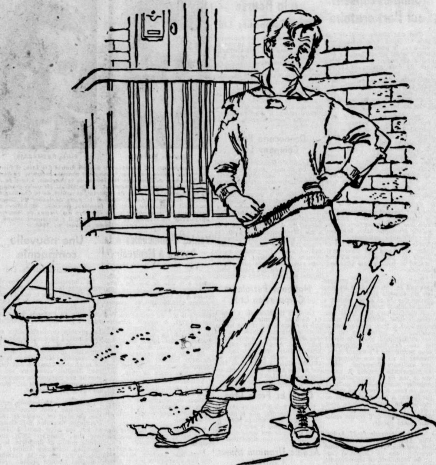
Pie XII—Extrait de la lettre encyclique "Quemadmodum" 6 janvier 1948

"Tous le savent, les prisons et les lieux de détention publique ne seraient pas encombrés d'un si grand nombre de malfaiteurs et de criminels si l'on employait plus largement et avec plus d'opportunité les moyens et les méthodes propres à prévenir les crimes,