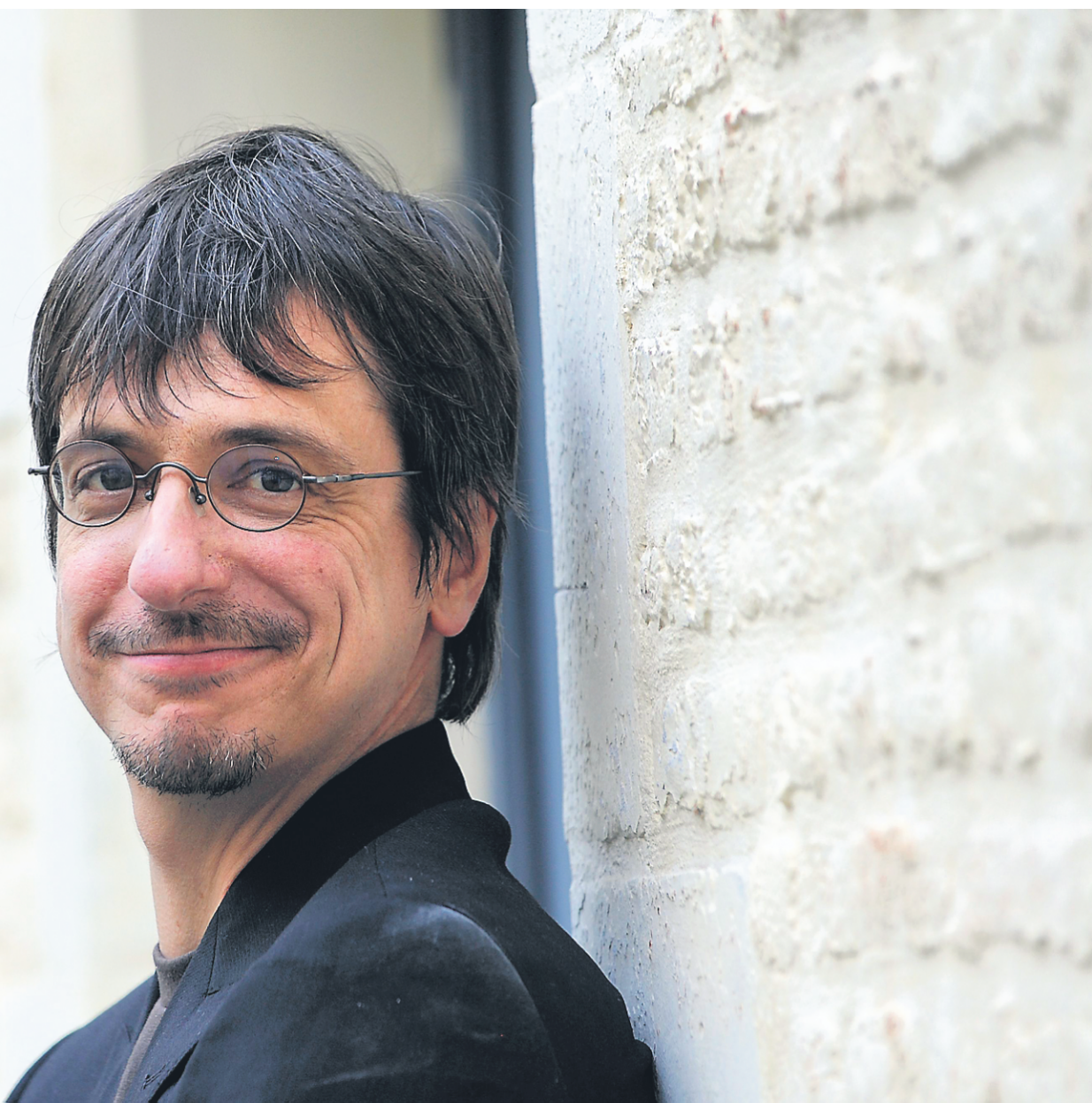
Les cinéastes Jean-Marc Vallée et Philippe Falardeau