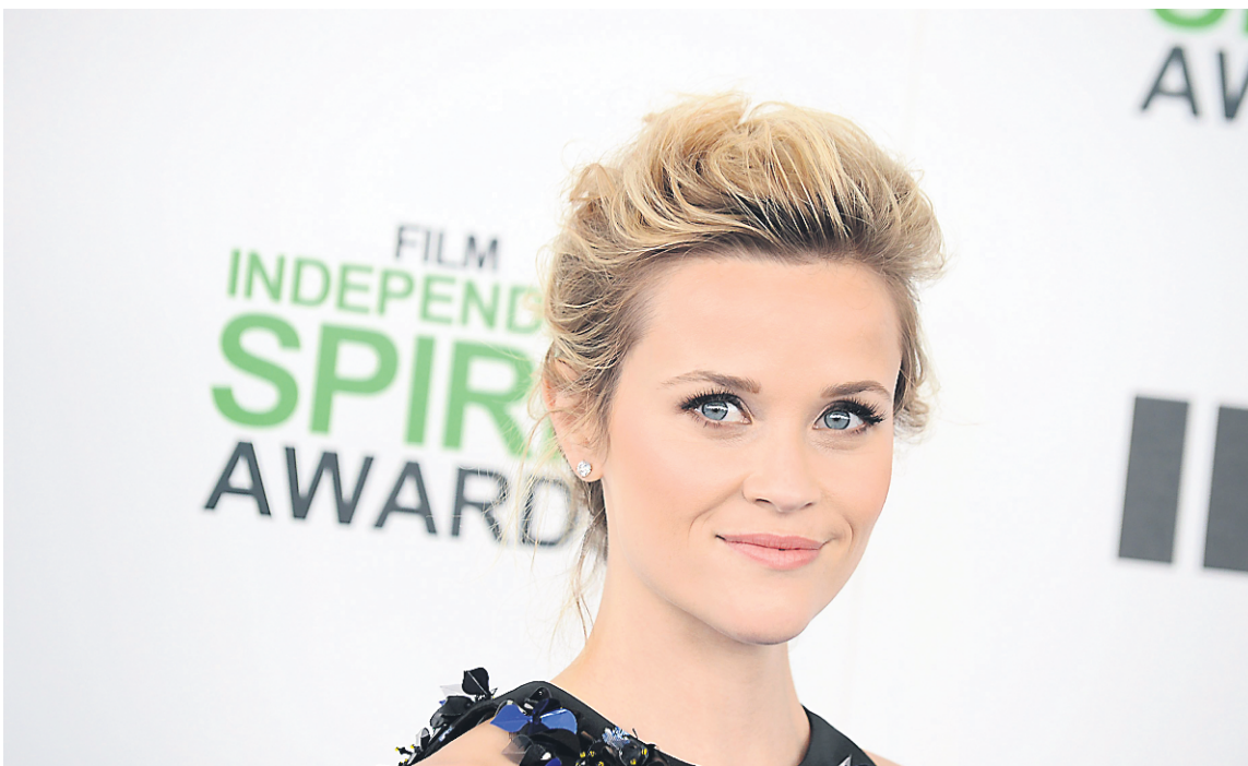
Une comédienne, deux réalisateurs; Reese Witherspoon tient la vedette des nouveaux films de Jean-Marc-Vallée (photo du haut, à gauche) et de Philippe Falardeau.

avec Tom Hardy, Noomi Rapace et le regretté James Gandolfini).