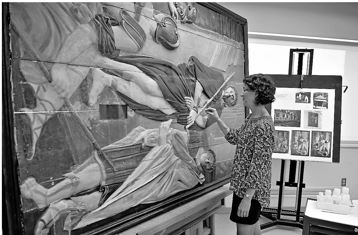
Après près de 800 heures de travail, la restauration de l'Ecce Homo, un des sept tableaux du Calvaire d'Oka créés en 1775, n'est toujours pas terminée. De nombreuses couches de peinture ont dû être retirées, a expliqué la restauratrice, Elisabeth Forest.

À travers le temps, les bas-reliefs de bois, exposés à des conditions météorologiques difficiles, ont été peints et repeints... Et pas toujours pour le mieux. En 1970, près de 200 ans plus tard, ils ont été retirés des petites chapelles blanches après avoir été