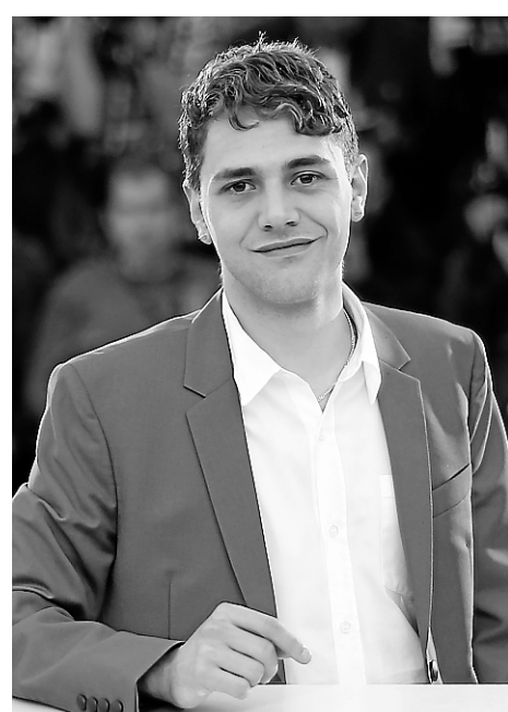
Xavier Dolan

The Dovekeepers est le tout premier projet de CBS Entertainment & CBS Television Studios Limited Series, une nouvelle filiale du réseau de télévision américain.