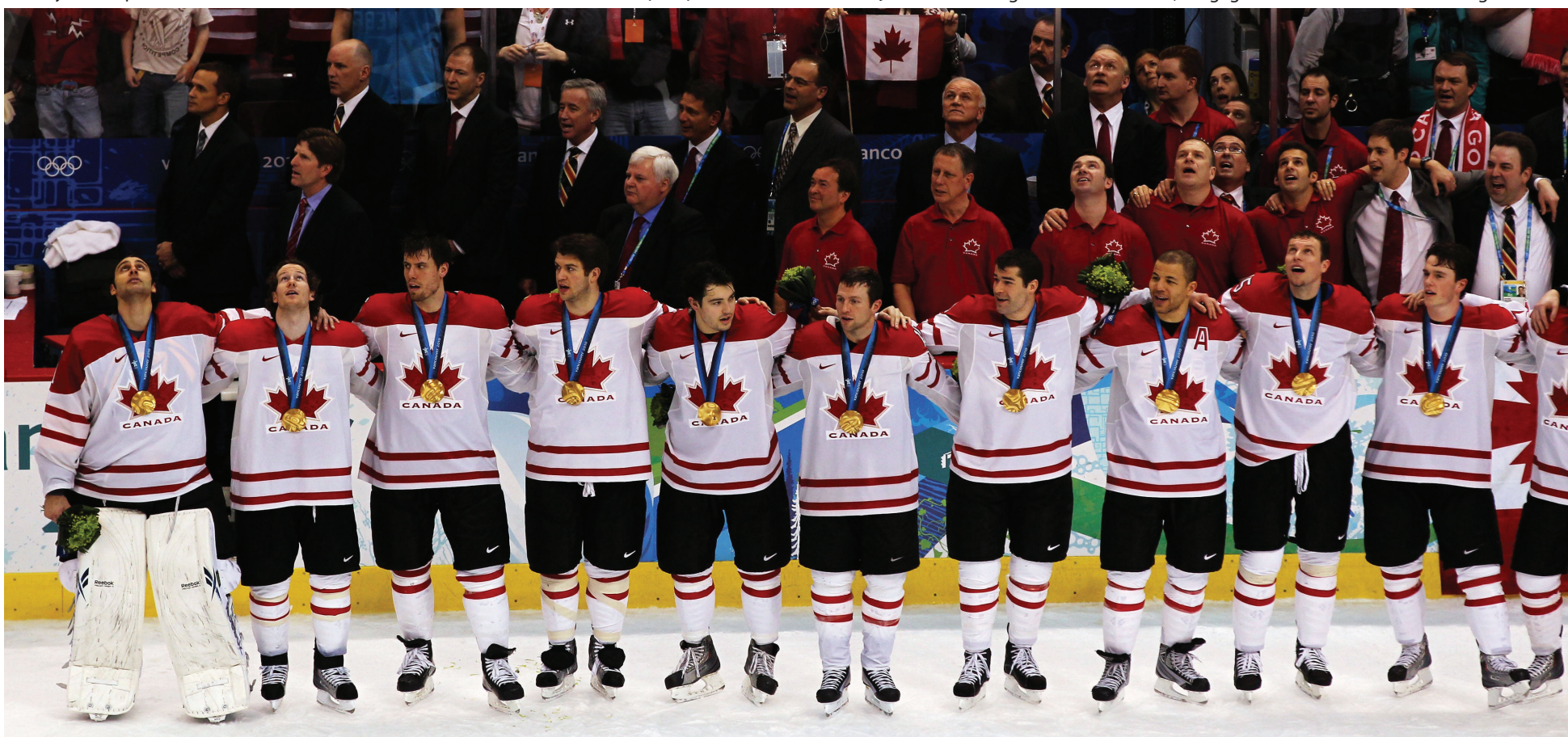
L'équipe de hockey du Canada durant les Jeux Olympiques de 2010