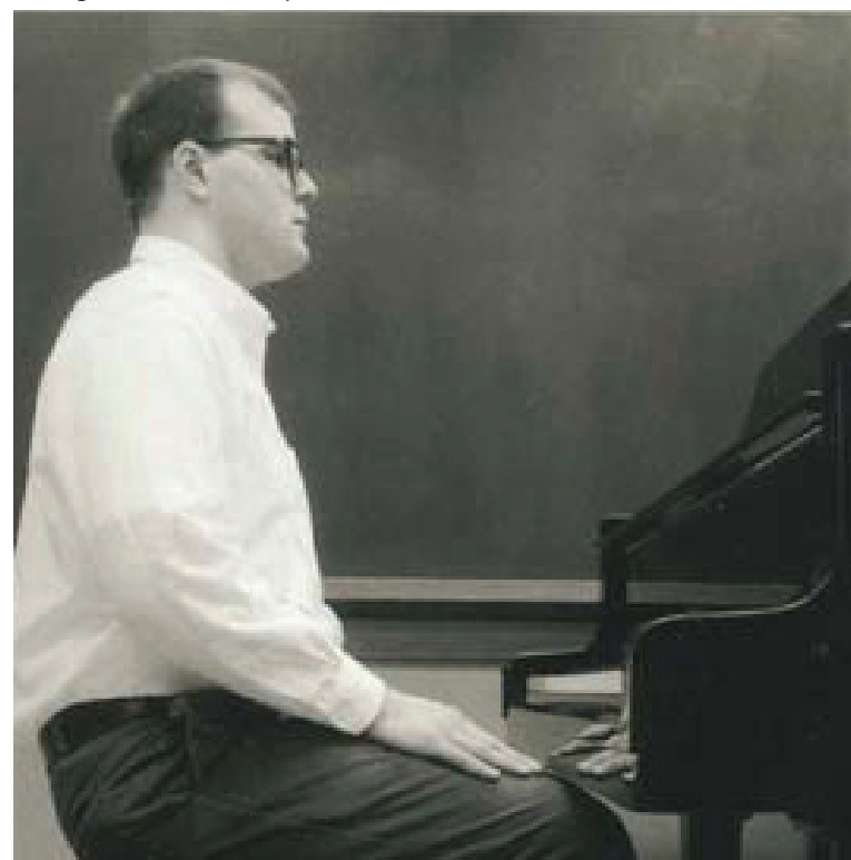
Pianiste en pleine interprétation de 4'33" de John Cage

Mais aussi étrange que cela puisse paraître, l'inspiration va se loger partout, même dans les batteries de cuisine pour certains. En 1927, Bohuslav Martinů signe le ballet La Revue de cuisine , aussi connu sous le nom La Tentation de la sainte Marmite . Il s'agit en fait d'une courte partition narrant les amours entre la Marmite et son Couvercle, contrariées par le Fouet à crème, le Balai et le Torchon à vaisselle... Une intrigue qui mériterait à coup sûr d'être adaptée dans un téléroman diffusé à TVA.