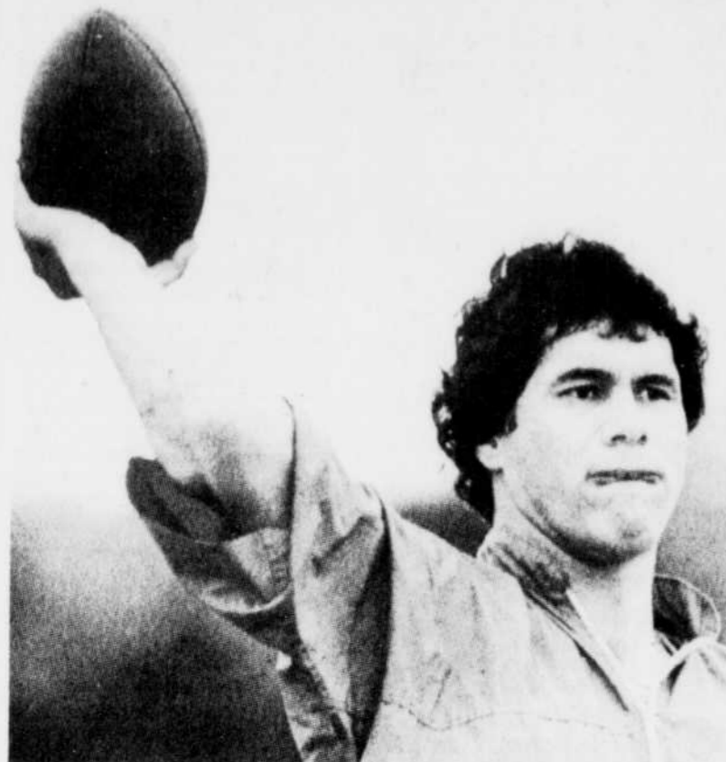
Le quart des Raiders de Los Angeles, Jim Plunkett, exerce son bras en prévision du match décisif.