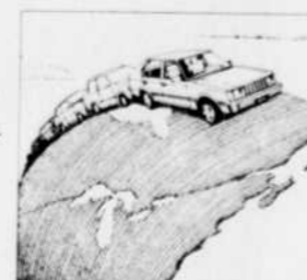
La Pony s'est gagnée des amis partout au monde. Elle est maintenant chez nous!

Dans le but de vérifier son adaptabilité aux hivers canadiens, une flotte de Pony a passé l'hiver dernier à Kapuskasing (Ontario). En quatre mois, les voitures ont subi l'équivalent de cinq années d'utilisation. L'épreuve fut concluante: la Pony peut affronter nos hivers.