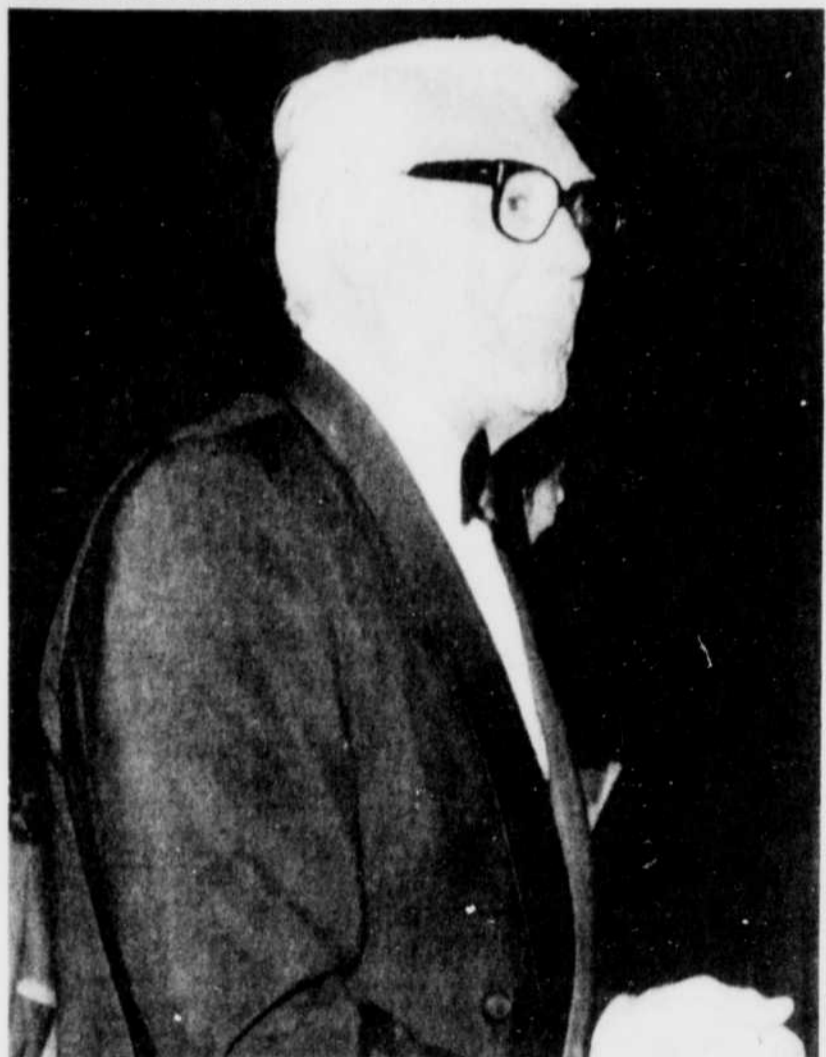
Malgré ses 80 ans, Cary Grant reste toujours aussi svelte et élégant.

plore, dit-il, c'est la tendance des acteurs à tout révéler, soit en otant leurs vêtements devant la caméra ou en écrivant un livre. Je trouve ça sordide et de mauvais goût".