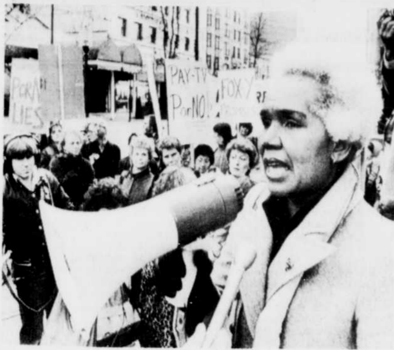
Contre la pornographie

La députée NPD Rosemary Brown a harangué une foule de 50 personnes qui protestaient, hier, contre la pornographie dans le centre-ville de Vancouver, incitant les Canadiens à boycotter la télévision payante. Des manifestations du même genre se sont déroulées aussi dans d'autres villes canadiennes.