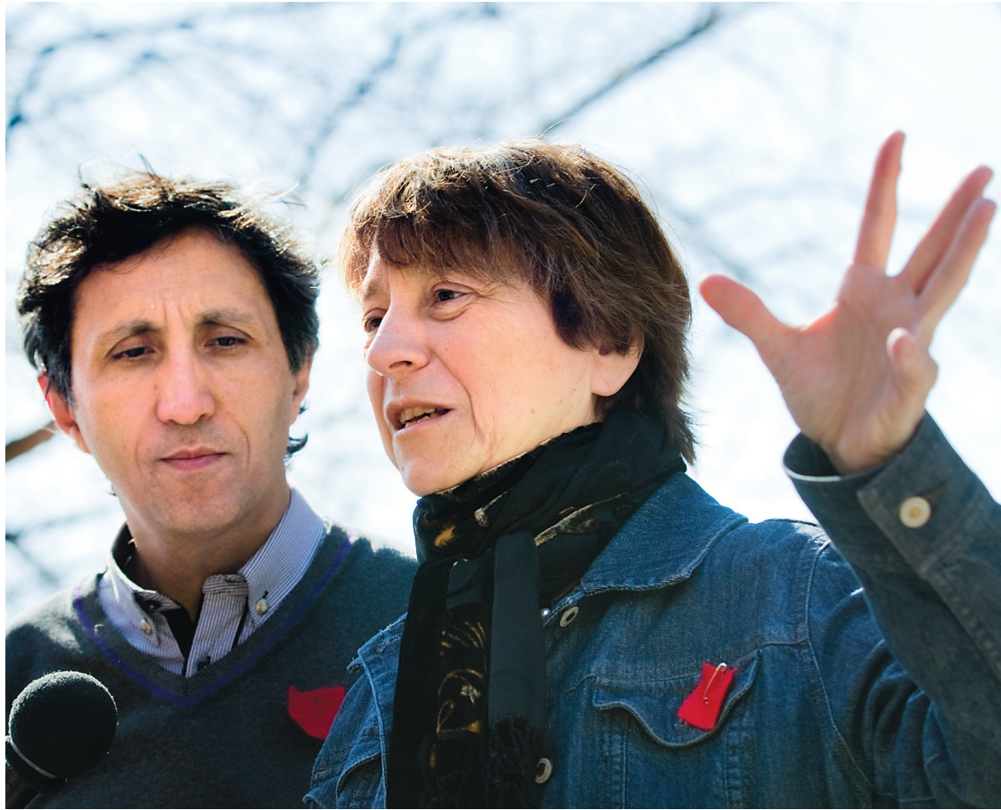
Amir Khadir et Françoise David demandent au ministre Raymond Bachand de mettre fin à sa politique du fœcicit zéro afin d'épargner la classe moyenne.