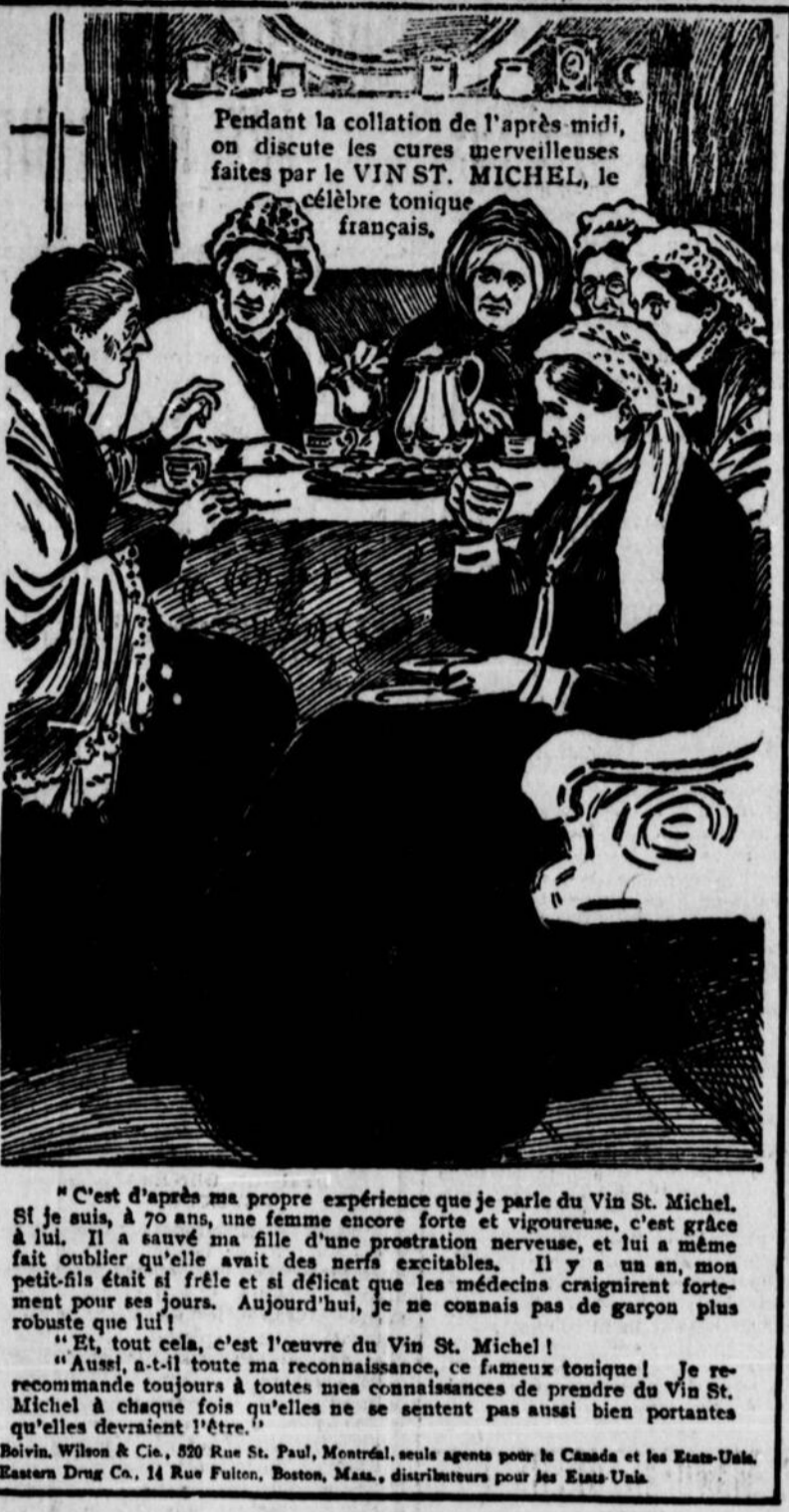
"C'est d'après ma propre expérience que je parle du Vin St. Michel. Si je suis, à 70 ans, une femme encore forte et vigoureuse, c'est grâce à lui. Il a sauvé ma fille d'une prostration nerveuse, et lui a même fait oublier qu'elle avait des nerfs excitable. Il y a un an, mon petit-fils était si frêle et si délicat que les médecins craignaient fortement pour ses jours. Aujourd'hui, je ne connais pas de garçon plus robuste que lui !

Pendant la collation de l'après-midi, on discute les cures merveilleuses faites par le VIN ST. MICHEL, le célèbre tonique français. "C'est d'après ma propre expérience que je parle du Vin St. Michel. Si je suis, à 70 ans, une femme encore forte et vigoureuse, c'est grâce à lui. Il a sauvé ma fille d'une prostration nerveuse, et lui a même fait oublier qu'elle avait des nerfs excitable. Il y a un an, mon petit-fils était si frêle et si délicat que les médecins craignaient fortement pour ses jours. Aujourd'hui, je ne connais pas de garçon plus robuste que lui ! "Et, tout cela, c'est l'œuvre du Vin St. Michel ! "Aussi, à-t-il toute ma reconnaissance, ce fameux tonique ! Je recommande toujours à toutes mes connaissances de prendre du Vin St. Michel à chaque fois qu'elles ne se sentent pas aussi bien portantes qu'elles devraient l'être ! Bovin, Wilson & Co., 230 Rue St. Paul, Montréal, seuls agents pour le Canada et les Etats-Unis. Eastern Drug Co., 14 Rue Falton, Boston, Mass., distributeurs pour les Etats-Unis.