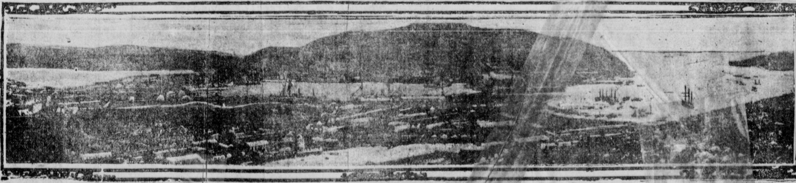
VUE GENERALE LE PORT ARTHUR MONTRANT LA RADE AINSI QUE LES COLLINES QUI ENTOURENT LA VILLE