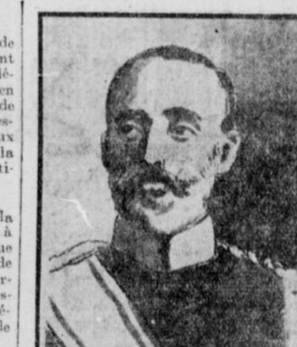
LE GENERAL NOGI, commandant de 7 troupes japonaises qui viennent de forcer Port-Arthur à capituler.

Washington, 3. — Le comte Cassini, ambassadeur russe aux Etats-Unis, a déclaré hier que la perte de Port Arthur n'empêcherait pas la Russie de combattre jusqu'à la fin. La capitulation ne peut qu'éprouver la Russie.