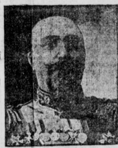
LE GENERAL NOGI, l'héroïque et vaillant défenseur de Port-Arthur.

Le rapport de la capitulation de Port Arthur a étendu un voile de profonde tristesse sur toute la Russie.