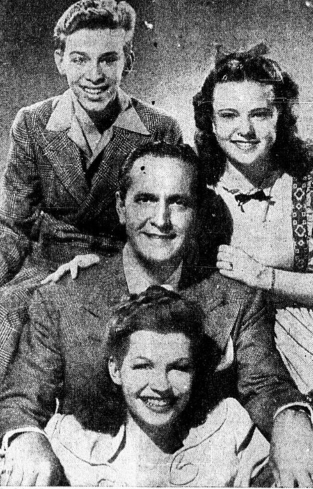
Fredric March, Betty Field, Joan Carroll et Skippy Homeier qui jouent les principaux rôles dans "Tomorrow-The World!", film présentement à l'affiche de ce théâtre.

Les paupéres clignent cinq à six fois par minute.