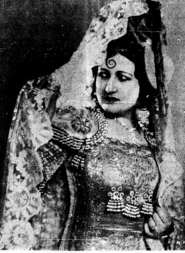
L'irrésistible BRUNA CASTAGNA du Metropolitan Opera de New-York, étourna une fois de plus les amateurs de l'opéra, quand le 9 septembre prochain, au Colisée, elle interprétera la Carmen de Bizet.