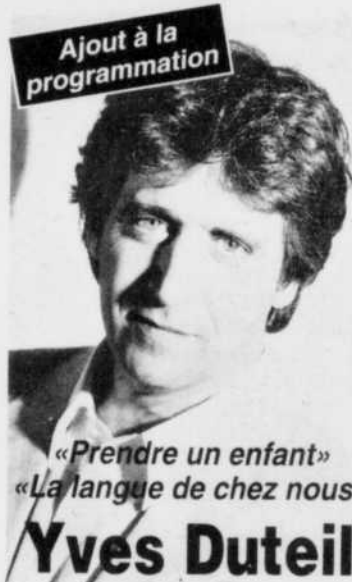
«Prendre un enfant» «La langue de chez nous» Yves Duteil

Abonnez-vous à la chanson! Choisissez 3 spectacles différents à prix régulier, obtenez GRATUITEMENT le 4 e de votre choix