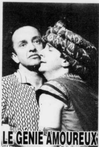
LE GÉNIE AMOUREUX

Abonnez-vous au théâtre! Choisissez 3 pièces différentes à prix régulier, obtenez GRATUITEMENT la 4 e de votre choix