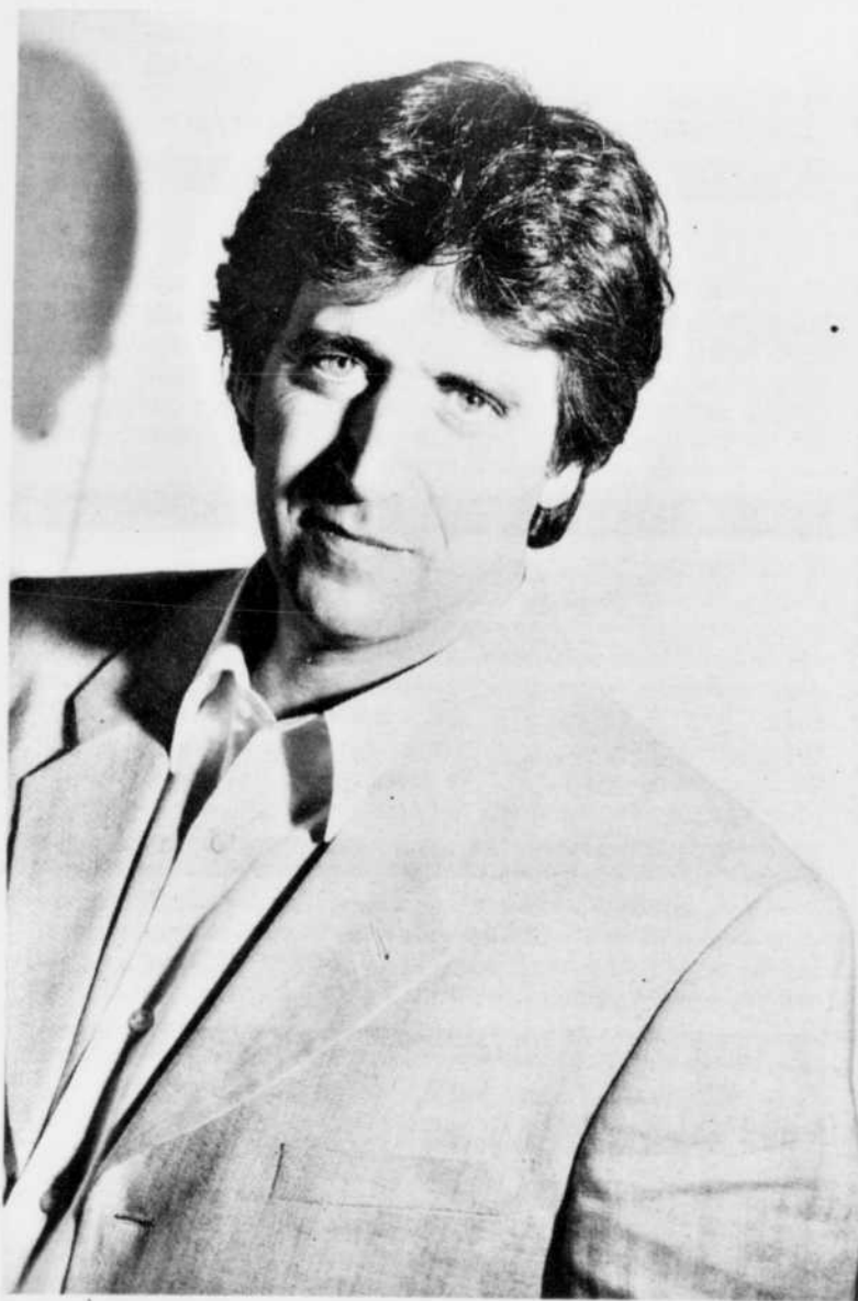
SPECTACLE - Le chanteur français Yves Duteil sera en spectacle à l'auditorium Dufour de Chicoutimi le 11 mars.

Et le spectacle qu'il amène au Québec est aussi comme ça: dépouillé, très acoustique, avec trois musiciens seulement. On y entendra toutes les chansons du nouvel album, plus les grands succès que le public réclame, et aussi des chansons moins connues pour lesquelles Yves Duteil éprouve une tendresse particulière: «ce sont mes préférences, et je veux les faire découvrir: c'est un spectacle de partage et d'échange», promet-il.