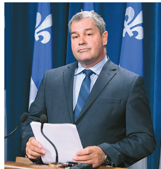
Yves Bolduc a été nommé à la tête du ministère de l'Éducation le printemps dernier.