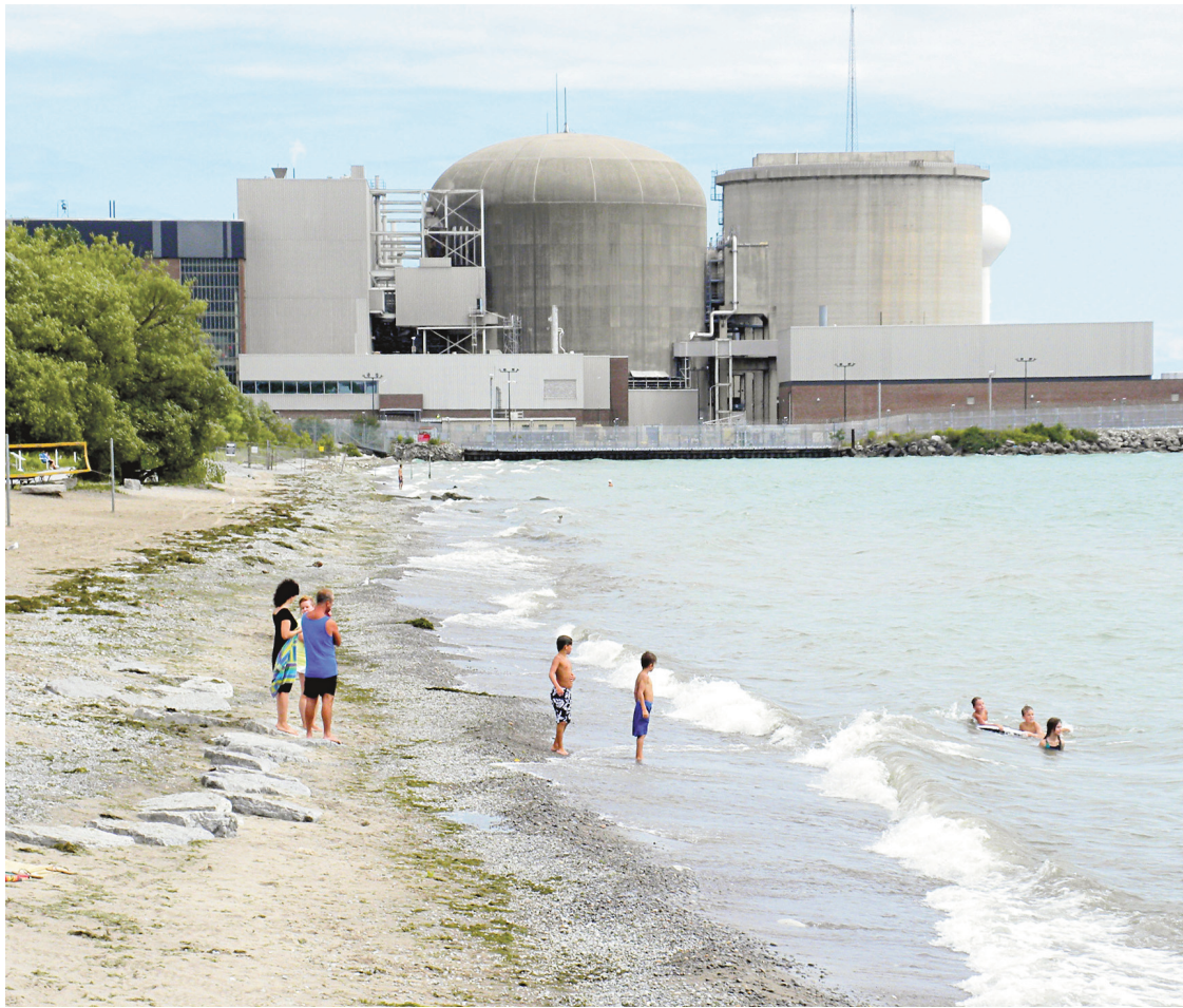
La centrale nucléaire de Pickering, à l'est de Toronto

Troisièmement , Hydro-Québec elle-même reconnaît qu'il lui serait impossible de répondre aux besoins de l'Ontario toute l'année.