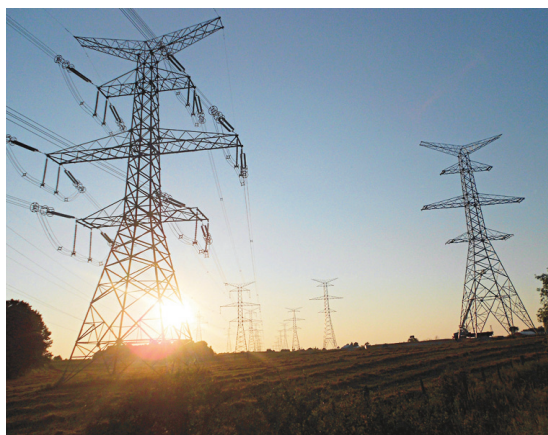
Une ligne de transmission de la centrale de Bruce, en Ontario

Petit calcul: la moitié du coût mentionné précédemment est 2,85¢/kWh. Equiterre écrit: «Ce serait près du double qu'HQ touche actuellement en échange de la majorité de l'électricité qu'elle exporte.» Selon le rapport annuel 2013 d'HQ, nous apprenons (p. 11) qu'HQ a vendu en exportations nettes 30,8 TWh pour un montant de 1353 millions, ce qui donne un prix unitaire de 4,39¢/kWh. Le double de ce montant est 8,78¢/kWh, ce qui nous situe bien loin de l'estimation d'Equiterre.