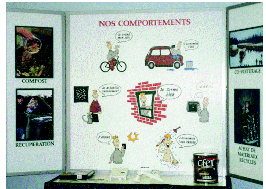
La caravane de l'efficacité énergétique : une occasion de mieux comprendre les problèmes liés à la consommation d'énergie et de découvrir une multitude de trucs pour économiser.

Pour plus de renseignements, nous vous invitons à contacter l'Agence de l'efficacité énergétique au numéro 1 877 727-6655 ou le Réseau des CFER (819) 758-4789.