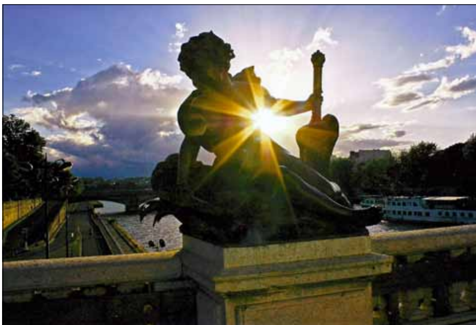
Pont Alexandre III, Paris , photographie de Marc-Antoine Mailloux-Labrousse, étudiant au Baccalauréat International

Marc-Antoine Mailloux-Labrousse a remporté le grand prix, un appareil-photo numérique, pour sa photo Pont Alexandre III , prise à Paris.