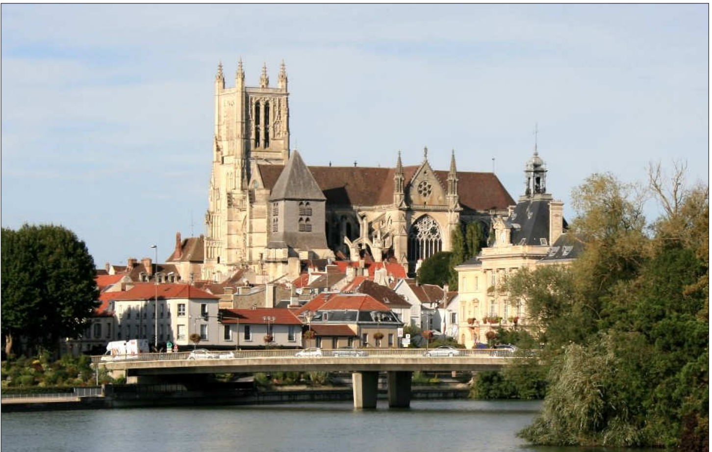
La cathédrale Saint-Étienne de Meaux

On ne peut parler de la cathédrale Saint-Étienne sans parler de celui qui fut surnommé l'Aigle de Meaux, Jacques-Bénigne Bossuet (1627-1704). En 1670, il devient le précepteur du dauphin, fils de Louis XIV, fonction qu'il