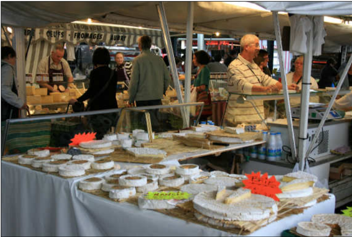
Le marché public de Meaux le samedi matin. Notez l'appétissant assortiment de fromages!

Aujourd'hui le vieux marché est plus calme que jadis, sauf le samedi où on y retrouve l'animation d'un grand marché. Sous la halle se retrouvent les producteurs régionaux de fruits et légumes, les marchands de fromage, dont le