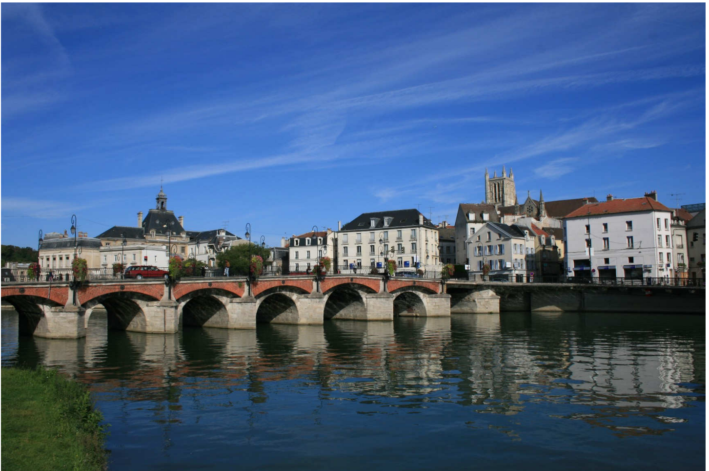
Le vieux pont du marché en 2011

Un seul pont permettait la traversée de la Marne sur l'ancienne voie romaine entre Meaux ( latinum ) et Troyes. Ce pont était aussi la seule voie de contact entre les deux quartiers fortifiés de la ville. Le vieux pont du marché était construit en bois sur pilotis, remplacés par des piliers de maçonnerie dans la première moitié du XVI e siècle, mais le tablier était toujours en bois. À la même époque on retrouvait sur le pont d'un côté des moulins, et de l'autre des échoppes et des boutiques. Au début du XX e siècle, comme en fait foi une carte postale, les moulins existaient toujours sur le pont avant leur disparition dans un incendie durant la nuit du 17 juin 1920; on peut comparer