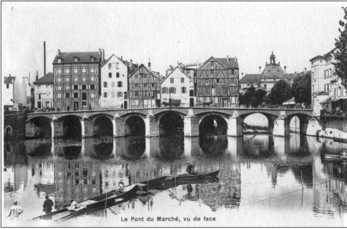
Le vieux pont du marché et les vieux moulins vers 1910.

cette photo d'époque avec celle prise par l'auteur en