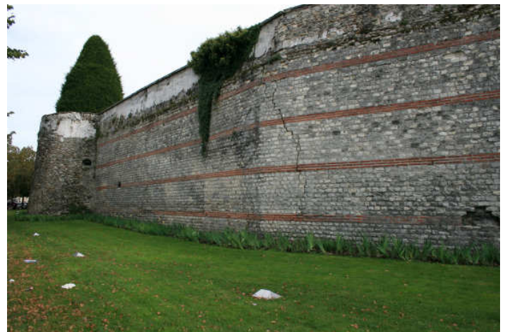
Le rempart gallo-romain.

Meldois est le nom que l'on donne depuis longtemps aux habitants de la ville de Meaux. Ce nom rappelle les Meldes , tribu gauloise qui s'installa sur le site de la commune aux abords du méandre de la Marne dans le plateau de la Brie. Après la conquête romaine, César donne le nom de latinum à la ville. À la fin du III e siècle, les Gallo-romains construisent à l'extrémité sud de la ville des remparts pour protéger les habitants des incursions barbares. Des vestiges de l'ancien castrum romain sont toujours présents dans la vieille ville de Meaux sur la rive droite de la Marne.