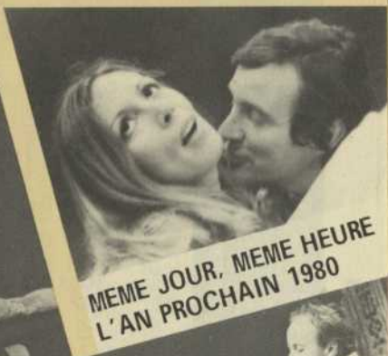
MEME JOUR, MEME HEURE L'AN PROCHAIN 1980