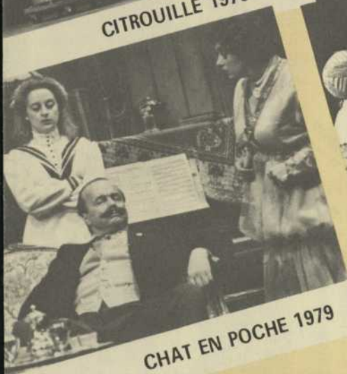
CHAT EN POCHE 1979