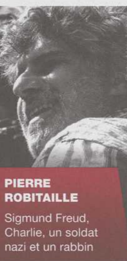
PIERRE ROBITAILLE Sigmund Freud, Charlie, un soldat nazi et un rabbin

LA DURÉE DU SPECTACLE EST D'ENVIRON 1 H45 SANS ENTRACTE