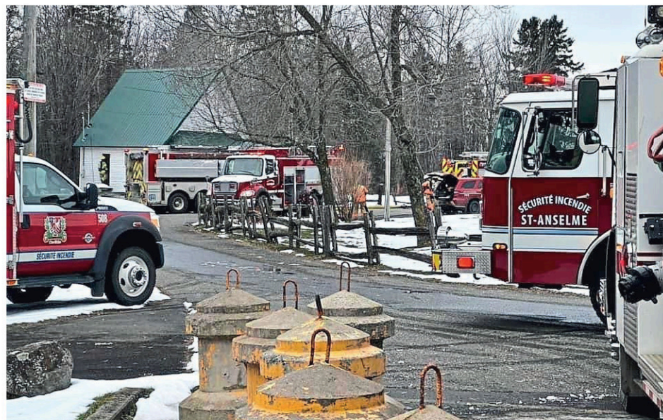
Scène du début d'incendie survenu le mardi 29 novembre en fin d'avant-midi au chalet des Chutes Rouillard de Saint-Anselme.

Le 10 novembre dernier, les agents de la Sûreté de la MRC de Bellechasse, accompagnés de membres du Bureau de coordination du soutien opérationnel (BCSO), ont effectué une opération Impact ayant pour but l'intervention ciblée en code de la sécurité routière. Au total, 34 avertissements et constats d'infractions ont été délivrés relativement à des infractions telles que le port de la ceinture de sécurité et l'utilisation du téléphone cellulaire au volant.