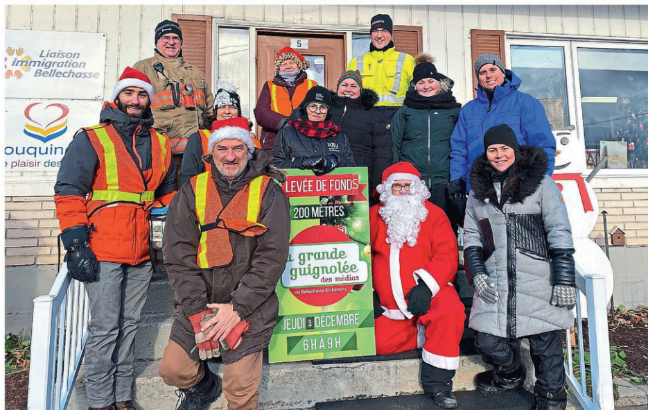
Des bénévoles ayant pris part à la Guignolée des médias, réunis devant les locaux de l'organisme Alpha Bellechasse à Saint-Anselme.