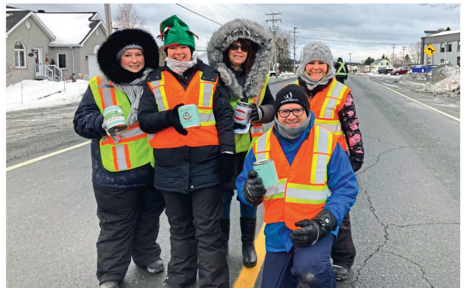
Une belle équipe de bénévoles était en place au barrage de Sainte-Justine.

Rappelons aussi que la Cueillette de la Solidarité Bellechasse-Etchemins, qui est en cours depuis le 7 novembre, se poursuivait jusqu'au mercredi 7 décembre.