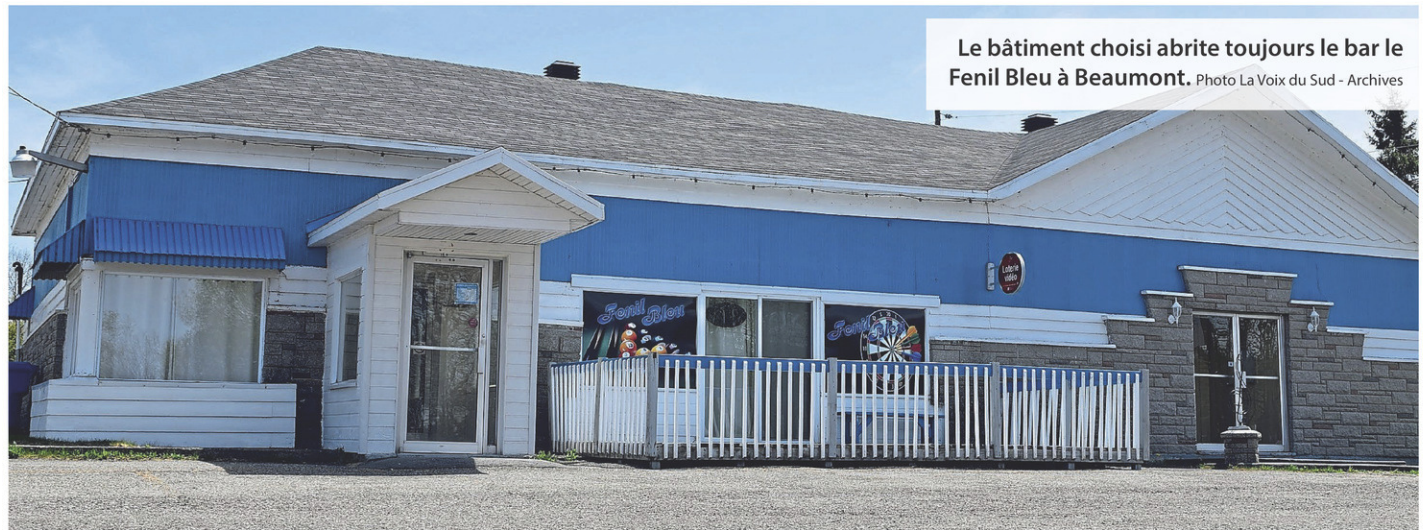
Le bâtiment choisi abrite toujours le bar Le Fenil Bleu à Beaumont.

« Nous avons déjà adopté notre schéma d'aménagement et notre plan d'urbanisme, alors on ne peut rien faire pour l'instant. Si le gouvernement dit oui, alors là on peut refaire certaines choses », indique le maire.