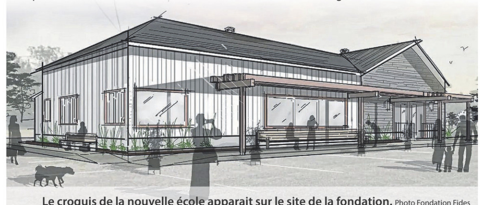
Le croquis de la nouvelle école apparaît sur le site de la fondation.

Ainsi, une offre d'achat a été déposée et acceptée par les propriétaires actuels. « Il reste cependant à obtenir le changement de zonage. Le montant à lever pour permettre la transaction est de 300 000 $, soit 130 000 $ pour la mise de fonds et 170 000 $ pour les travaux de rénovation et d'aménagement. »