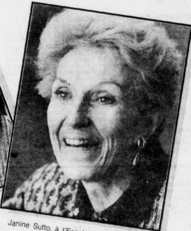
Janine Sutto, à l'Escale