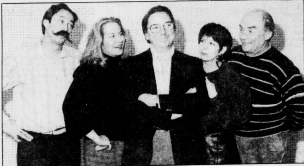
Les fidèles téléspectateurs de «Entre chien et Loup» seront heureux de retrouver cinq des principaux personnages réunis au Théâtre du Vieux Rocher dans «Un mensonge attend pas l'autre».