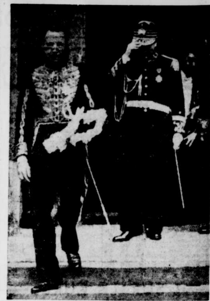
Sir Archibald Clark Kerr, le nouvel ambassadeur de Grande-Bretagne en Chine, photographié au sortir du consulat anglais de Tchungking, pour présenter ses lettres de créances au président Tchong Kai-Chek, au palais temporaire. Derrière Sir Archibald, on voit l'aide-de-camp du président de la Chine.

7 15—Mélodies rythmées. 7 30—Pot-pouri matinal. 8 00—Aubade. 8 15—Chansonnettes françaises. 8 30—Nouvelles. 8 45—Nouvelles. 9 00—Nouvelles. 9 15—Nouvelles. 9 30—Nouvelles. 9 45—Nouvelles. 10 00—Nouvelles. 10 15—Nouvelles. 10 30—Nouvelles. 10 45—Nouvelles. 11 00—Nouvelles. 11 15—Nouvelles. 11 30—Nouvelles. 11 45—Nouvelles.