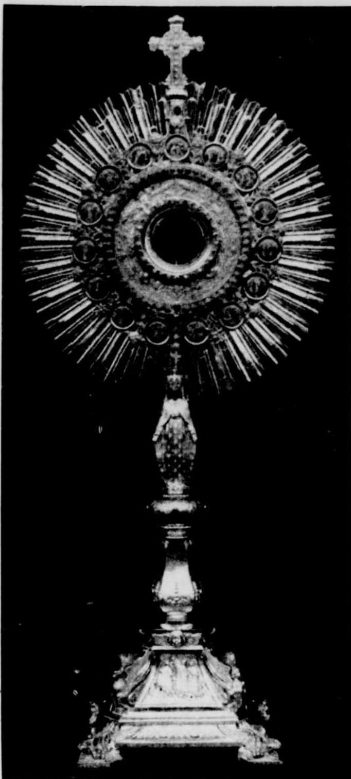
La photo ci-dessus représente le nouvel ostensor d'or du sanctuaire du Cap-de-la-Madeleine. Cette oeuvre d'art est le fruit des aumônes en bijoux de toutes sortes versés par les pèlerins de Notre-Dame du Cap ou abonnés aux Annales du Sanctuaire. L'ostensor mesure 35 pouces de hauteur, 16 de largeur, et pèse 17 livres. Il est en or sert de pierres précieuses. 15 émaux représentant les mystères du Rosaire, font couronne à la lunule. L'ostensor sera béni et inauguré le 19 juin, lors des fêtes du jubilé d'or du Pèlerinage, présidées par Son Eminence le Cardinal Villeneuve, o.m.i.