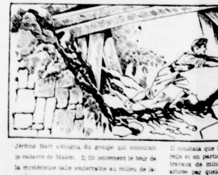
Jérôme Hart s'éleva du groupe qui entourait le cadavre de Macon. Il fit lentement le tour de la mystérieuse salle souterraine au milieu de laquelle se trouvait l'extraordinaire pucier.