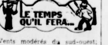
Vents modérés du sud-ouest; beau et chaud; orages électriques sur le soir et jeudi.

Cette annonce fut préparée pour la Canadian Daily Newspapers Association par la James Fisher Company, Limited.