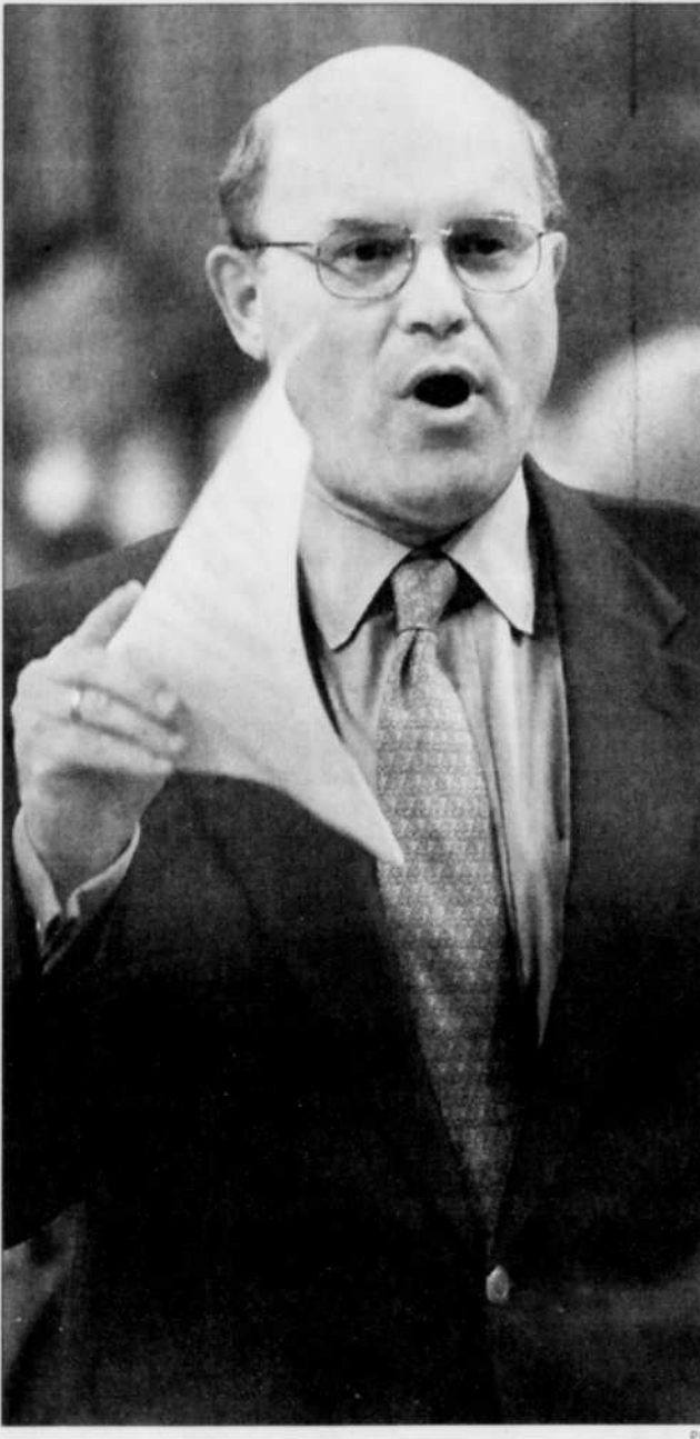
Le ministre des Transports, David Collenette, jongle encore avec plusieurs scénarios.

■ OTTAWA — Le gouvernement fédéral soumettra la structure d'Air Canada à d'importantes modifications, affirme le ministre des Transports, David Collenette, qui n'a cependant pas encore précisé le montant qu'il était prêt à consentir pour aider le transporteur mal en point.