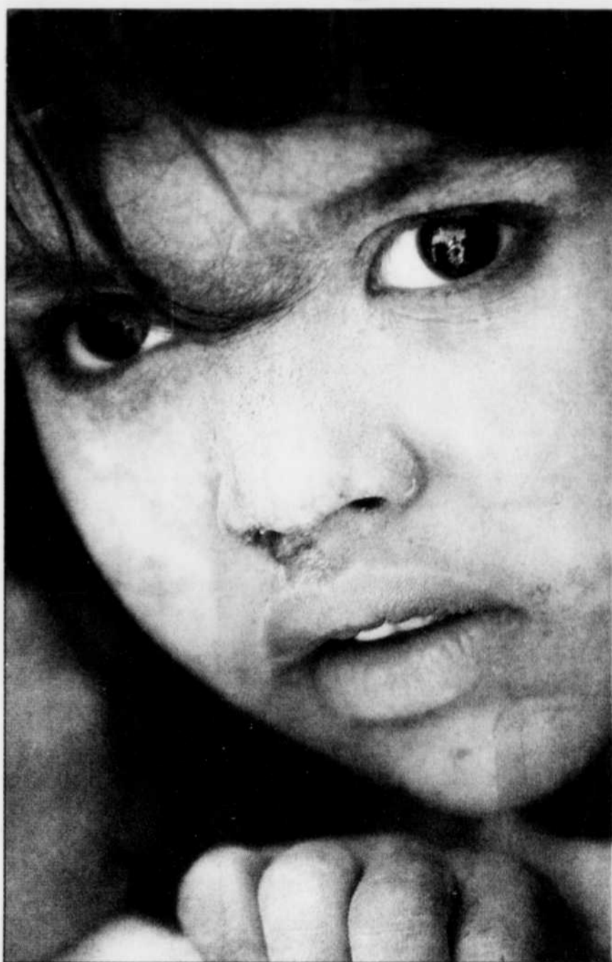
Une jeune réfugiée afghane lance un regard inquiet de sa demeure dans un camp en banlieue d'Islamabad, au Pakistan. Plus de deux millions d'Afghans ont trouvé refuge au Pakistan et près d'un million pourraient encore venir.

Les 30 000 Afghans qui ont réussi à s'infiltrer au Pakistan en versant un