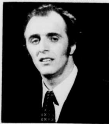
Des compositions de Gilles VIGNEAULT à «Quatre chansons», tous les jours de la semaine à 10 h 15.