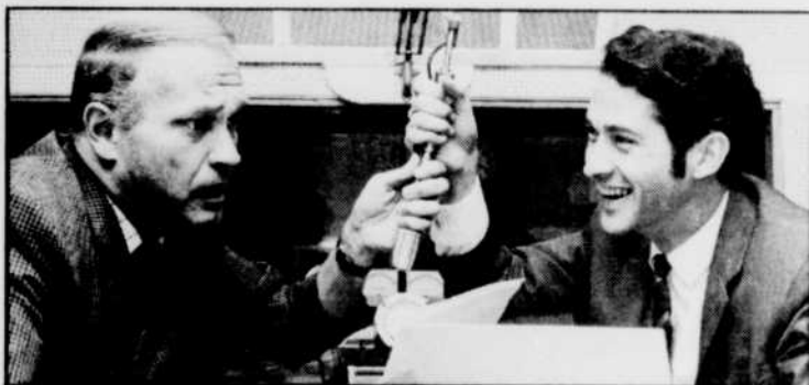
Une musique choisie est entrecoupée de bonnes blagues, de communiqués de la circulation, de la météo.