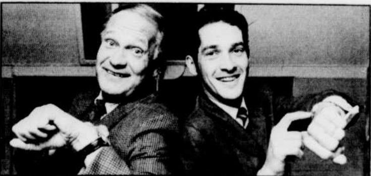
Dès 9 h 00, ils peuvent dire: «Mission accomplie».