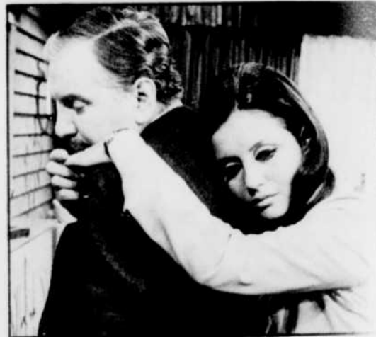
Jean DUCEPPE et Louise MARLEAU.