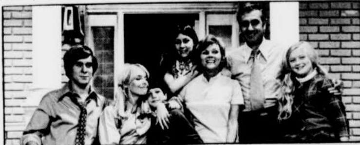
A «Quelle famille», le dimanche à 19 h 30, en compagnie de Robert TOUPIN, Ghislaine PARADIS, Martin et Isabelle LAJEUNESSE, Janette BERTRAND, Jean LAJEUNESSE et Joanne VERNE, nous sommes témoins de la vie quotidienne chez les Tremblay.