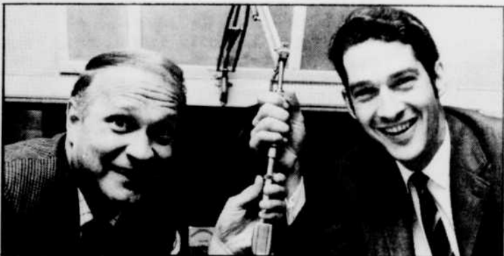
C'est bien réveillés qu'ils s'apprentent à tirer du lit les auditeurs de CBF-690.