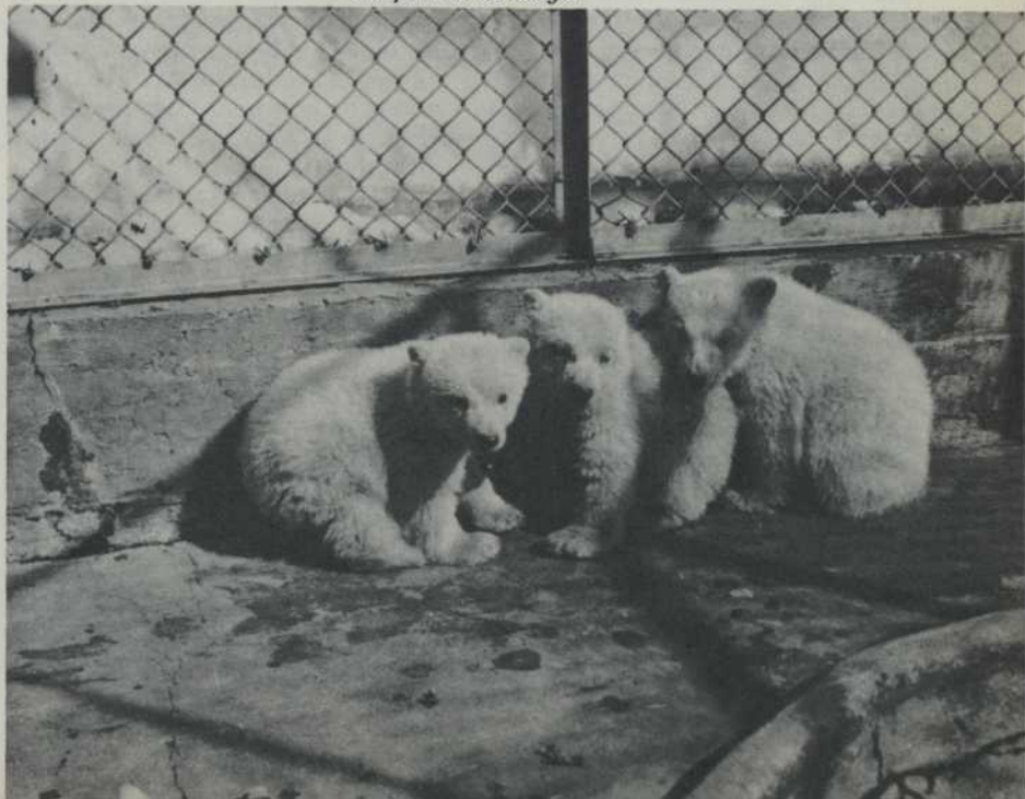
Rançon de l'esclavage.