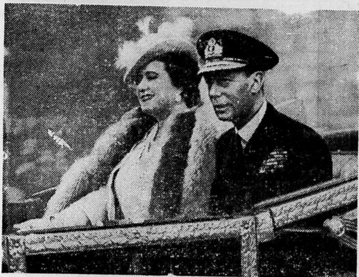
Le roi et la reine quittant le palais Buckingham pour se rendre à la cérémonie d'ouverture de la Chambre des Communes, le jour de la célébration en Angleterre de la victoire sur le Japon.

On veut savoir (Suite de la page 2) l'emploi, elle a pu accumuler une réserve qui lui permettra de passer à travers les mauvais jours.