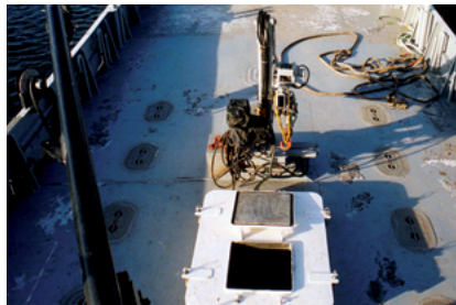
Cale de bateau