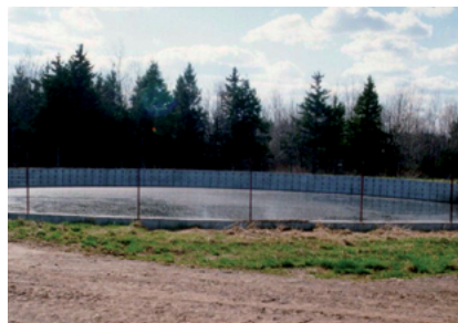
Fosse à lisier