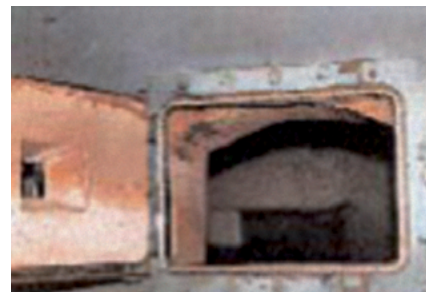
Four / Chaudière / Incinérateur

Plusieurs synonymes peuvent correspondre aux noms des espaces clos proposés.