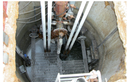
Puits mouillé d'une station de pompage d'eaux usées