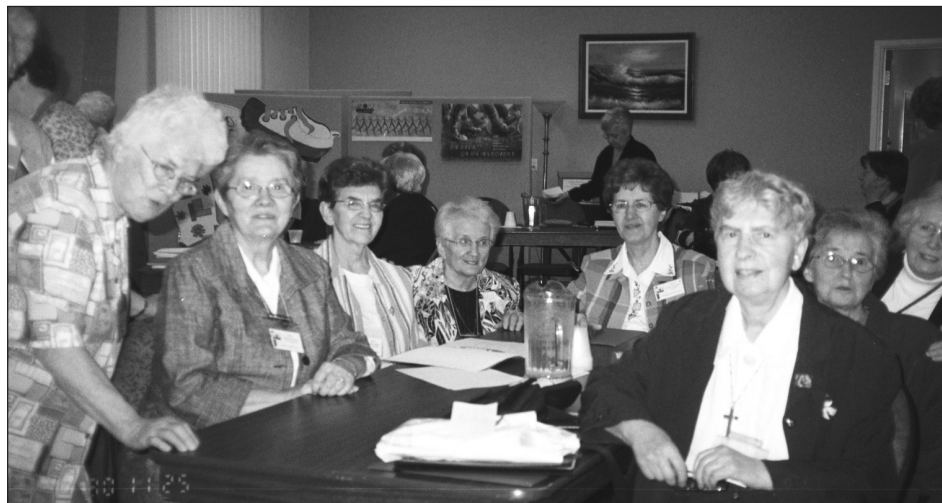
Lors de l'assemblée générale de mai 2010

Dans toutes les régions, une lettre a été signée et adressée au Premier Ministre du Canada pour contrer le trafic des personnes lors des Jeux de Vancouver. Les groupes de femmes connus dans nos régions ont été rejoints, à cette occasion des Jeux Olympiques. Pour les sensibiliser davantage, au trafic des êtres humains chez nous, un dépliant réalisé à partir du document « Nous sommes un village