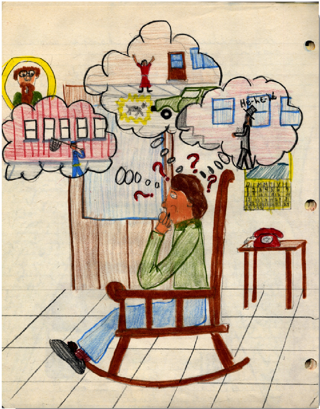
Tom, à la maison, s'inquiète de plus en plus pour son chat.