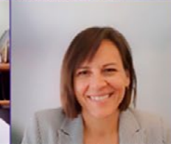
Ministre Isabelle Charest