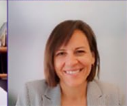
Ministre Isabelle Charest