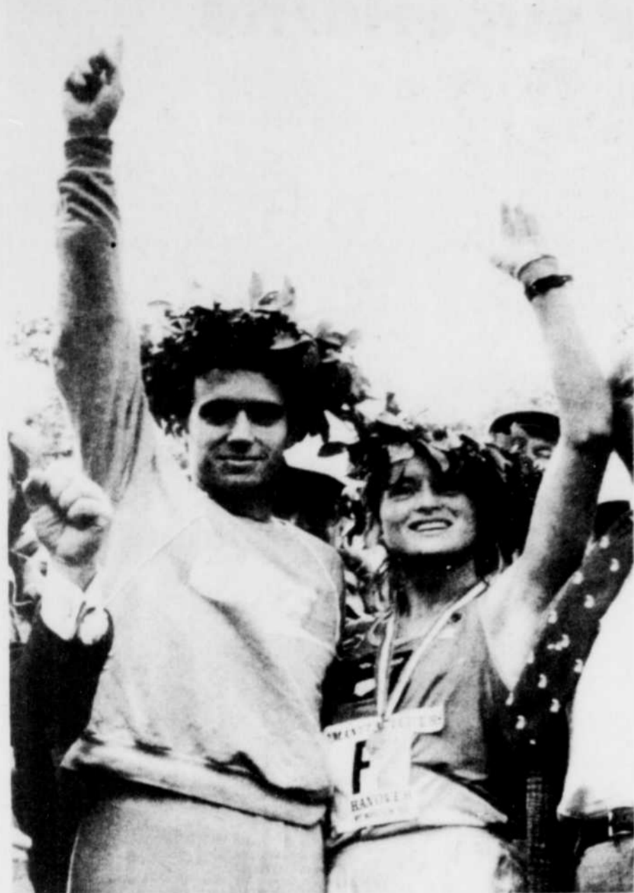
Alberto Salazar et Allison Roe sont les nouveaux monarques du marathon de New York.

"Ils sont voleurs et hypocrites" —Salazar