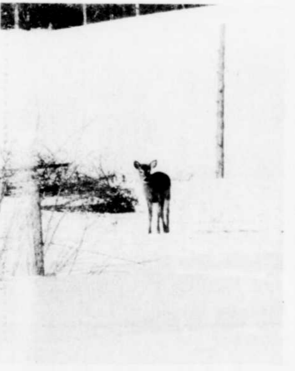
L'Association Régionale de Conversation des Cantons de l'Est demande à tous les chasseurs de s'abstenir de tirer sur les femelles et les petits du chevreuil samedi le 31 octobre. Le chevreuil est encore peu abondant dans plusieurs territoires de la région.