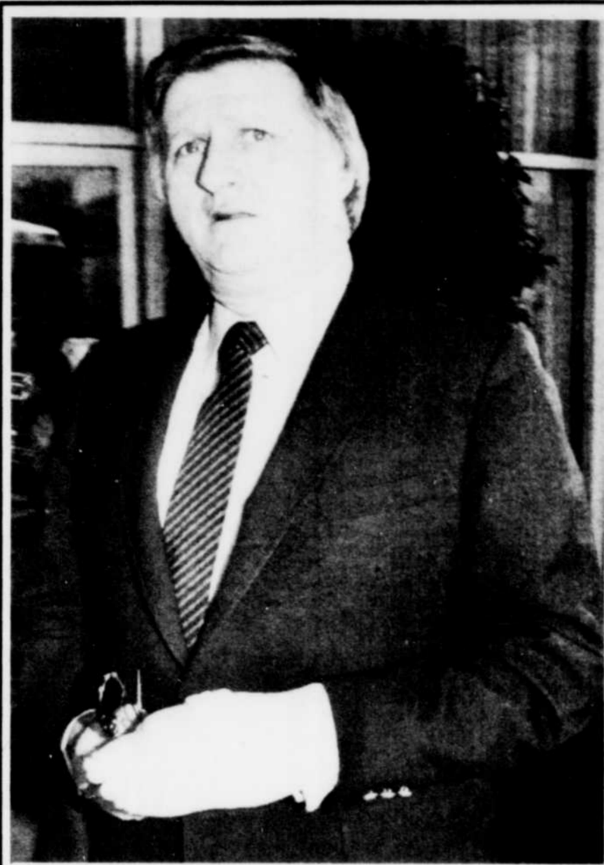
Blessé à la bouche et un bandage sur une main probablement fracturée, George Steinbrenner se souviendra probablement longtemps de son dernier séjour à Los Angeles... et pas nécessairement parce que ses Yankees y ont subi trois défaites consécutives... Steinbrenner comprendra-t-il mieux son ex-gérant Billy Martin à la suite de cette altercation?

NEW YORK (AP) — C'est un Burt Hooton bien reposé qui tentera d'aider les Dodgers de Los Angeles à remporter la Série mondiale de baseball majeur, ce soir au Yankee Stadium, lors de la sixième rencontre de cette série finale.