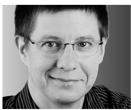
PHILIPPE CANTIN CHRONIQUE

LA PREMIÈRE ÉTOILE DE LA SEMAINE: Rory McIlroy, superbe vainqueur de l'Omnium des États-Unis. Le golfeur de 22 ans a dominé ses adversaires. Il a surtout démontré sa force de caractère après sa malheureuse expérience du Tournoi des Maîtres, lorsqu'il a échappé une avance de quatre coups à la dernière ronde.