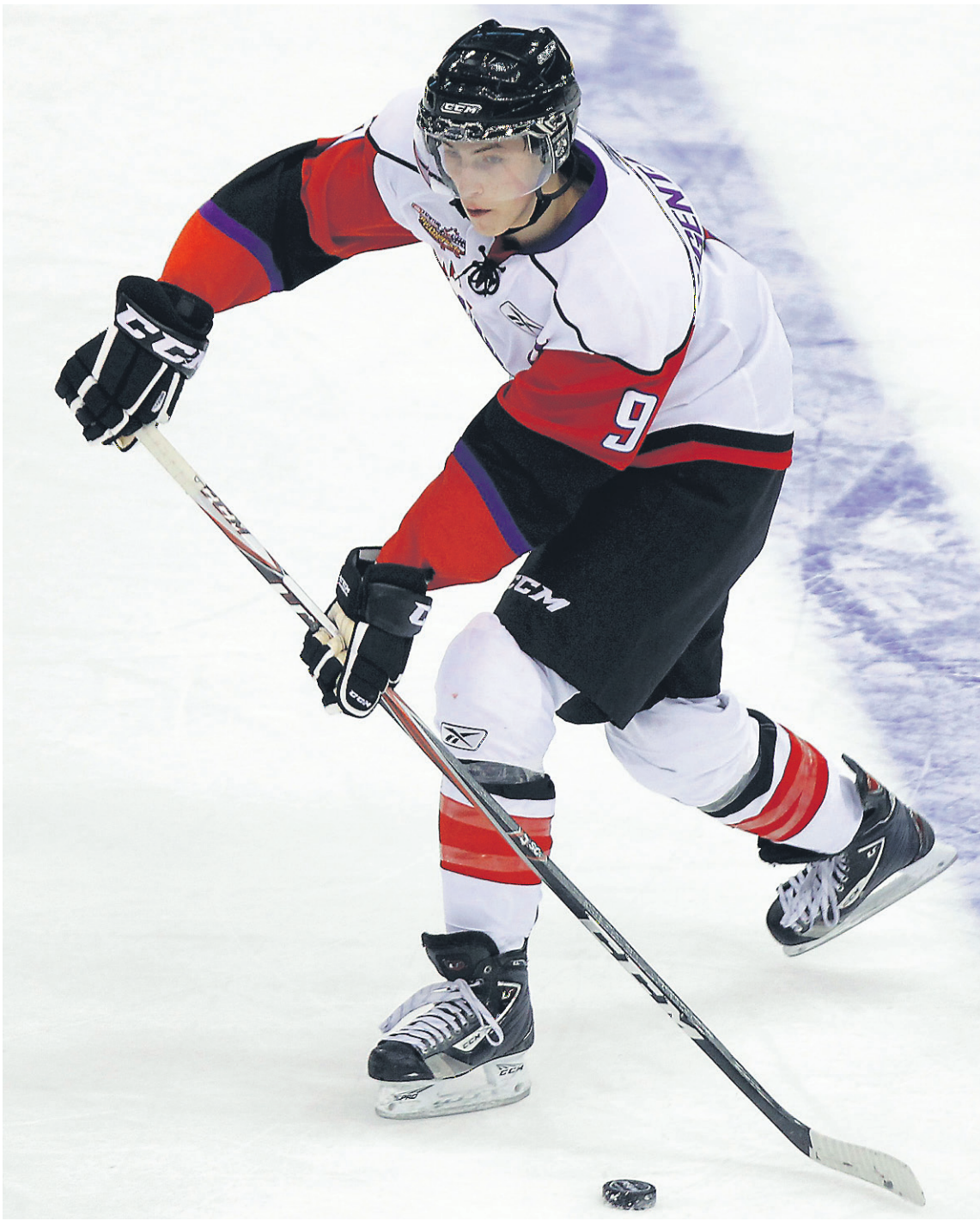
Les Oilers d'Edmonton pourraient jeter leur dévolu sur l'attaquant Ryan Nugent-Hopkins, des Rebels de Red Deer, au premier rang du prochain repêchage de la LNH, vendredi au Minnesota.