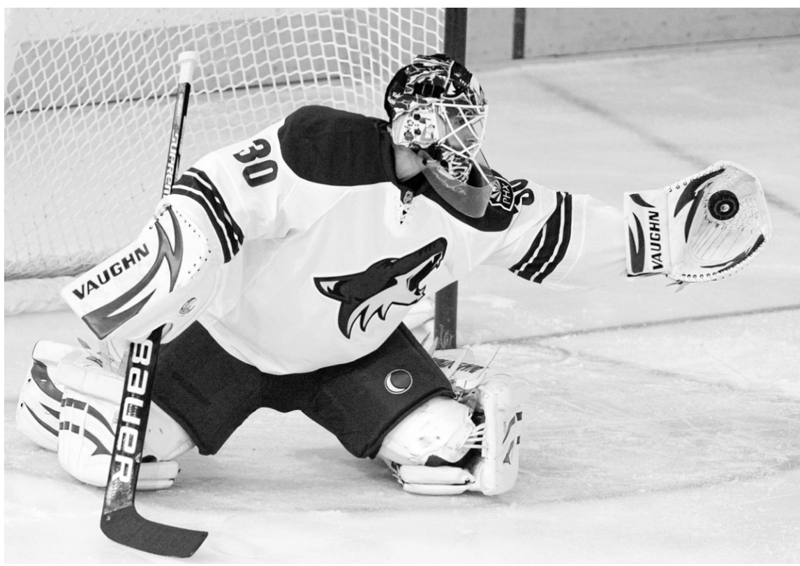
Ilya Bryzgalov représente-t-il la solution aux problèmes des Flyers de Philadelphie devant le filet?

R Richards, 31 ans, sera assurément le joueur autonome le plus courtisé à compter du 1 er juillet. Vu les exigences salariales du monsieur, les acheteurs sérieux ne seront pas si nombreux. À son âge, Richards voudra sûrement quelque chose comme 7 millions de dollars par saison pour les huit prochaines années. Ce n'est évidemment pas tout le monde qui peut se permettre un tel contrat. Les Maple Leafs de Toronto, eux, peuvent se le permettre. Jean-Sébastien Giguère et son énorme contrat ne seront pas de retour, et le directeur général Brian Burke adore les coups d'éclat. De plus, Richards lui-même a déjà déclaré qu'il ne détesterait pas patiner un jour