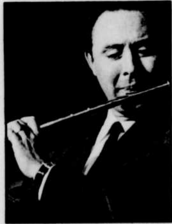
Jean-Pierre RAMPAL, aux "Chefs-d'oeuvre..." lundi.