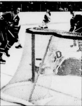
A 14 heures, le 6 janvier, à la télé, présentation du match Canadiens-Rangers. Notre photo: une partie Montréal-Toronto.