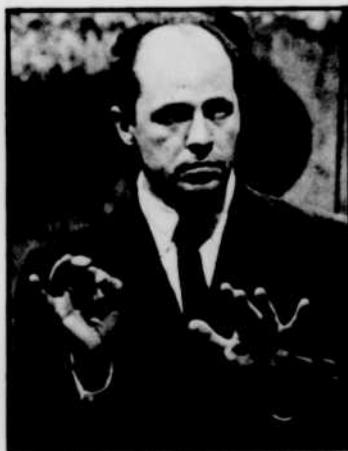
De la musique de Pierre BOULEZ (notre photo), à "Chronique du disque", samedi.