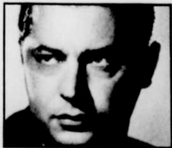
Rafael FRUENBECK DE BURGOS

Au Concert symphonique diffusé simultanément à la chaî- ne de radio et à CBF-FM, le mardi 9 janvier à 20 h 30 nous entendrons l'Orchestre sympho- nique de Montréal sous la direc- tion du chef d'orchestre espa- gnol Rafael Fruhbeck de Bur- gos. L'oeuvre au programme se- ra la Ire Symphonie de Gusta- ve Mahler. Cette grande fresque sonore évoque des souvenirs de jeunesse du musicien où se mê- lent des descriptions bucoliques et des réflexions métaphysiques sur l'enfer et le paradis. La Ire Symphonie de Mahler date de 1888.