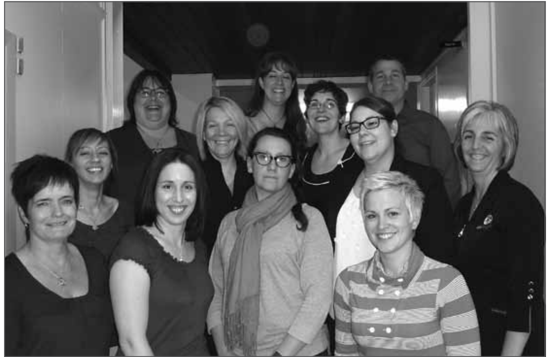
L'équipe du Flambeau

Merci encore de la part des professeurs, des parents et surtout des élèves.