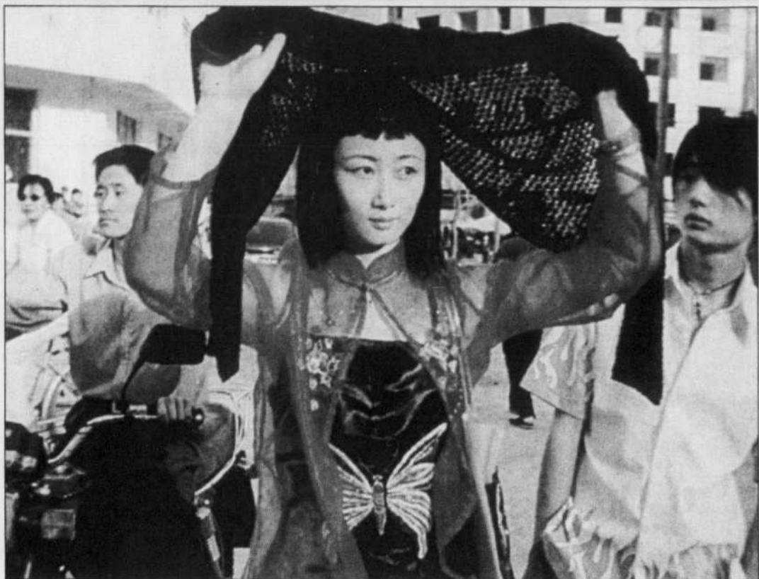
Le réalisateur chinois Jia Zhang Ke présente une chronique en demi-teintes d'une jeunesse découverte et aliénée.

D'ici un an, l'AMAQ doit se doter d'une charte et entend se faire reconnaître par la Commission de reconnaissance des associations d'artistes et des associations de producteurs (CRAAP). «Si on fait la preuve que le secteur qu'on veut représenter est négligé par la Guilde, on pourra se présenter devant la CRAAP». L'AMAQ veut se constituer solidement avant la fin du printemps prochain.