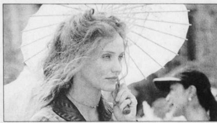
Cameron Diaz dans Gangs of New York .

En effet, cette Amérique que Scorsese a réinventée est un champ de bataille où s'opposent l'innocence et la chair (présentée ici dans tous ses états), la pureté et le sang, la trubu et la république. Bref, un immense terrain vague habité par des gangs qui, entre l'enfance et le tombeau, en revendi-