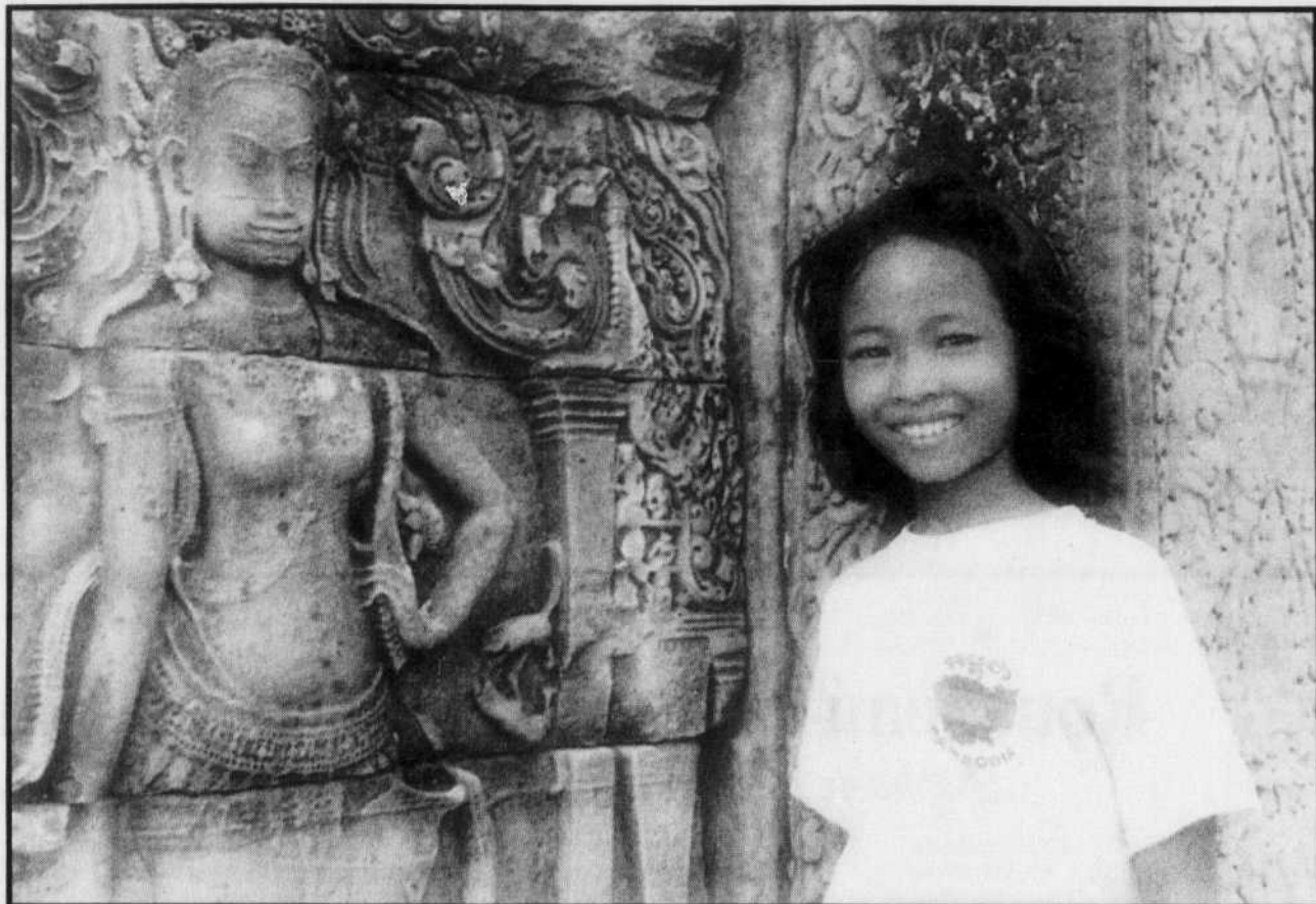
Un sourire en cadeau.