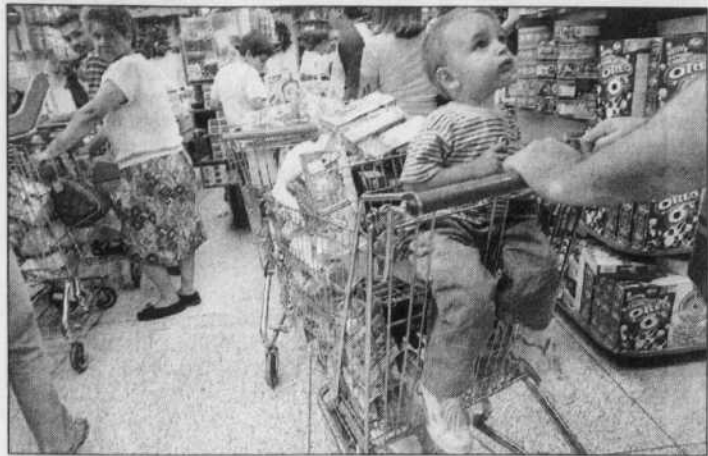
Les consommateurs emmagasinent à Caracas alors qu'au 18 e jour de grève générale s'installe la pénurie alimentaire.