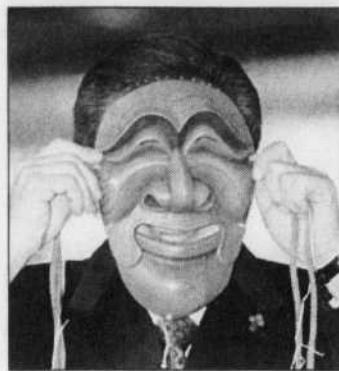
Roh Moo-hyun, célébrant hier sa victoire présidentielle à Séoul: masqué et démasqué.

Favori des jeunes générations, le candidat du PDM a promis de poursuivre les discussions et la coopération avec la Corée du Nord, la «politique du soleil» menée avec plus ou moins de succès par le dirigeant sortant.