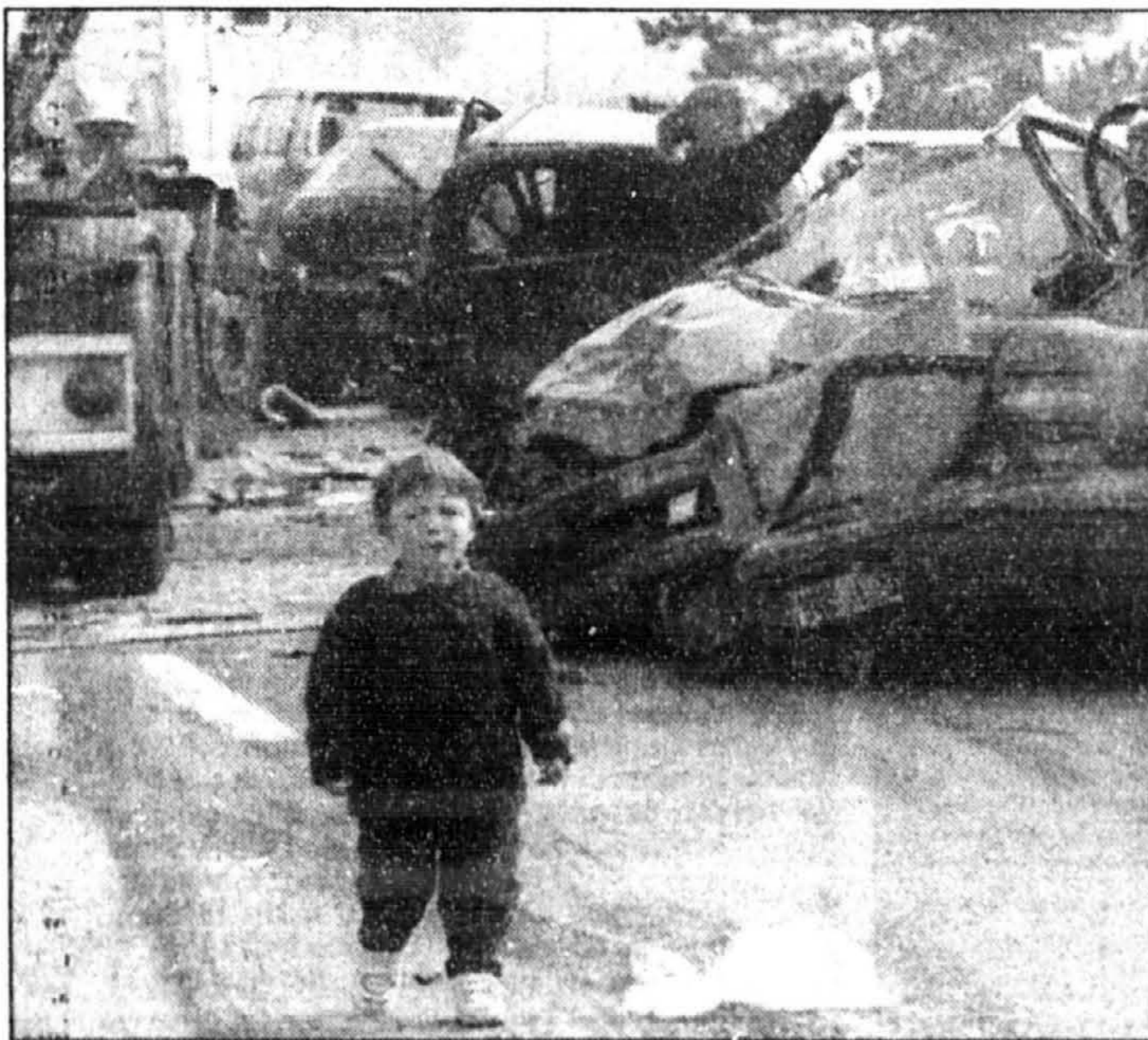
Un enfant en larmes marche sur l'autoroute de Normandie, devenue presque un cimetière d'autos à la suite du carambolage spectaculaire et meurtrier survenu hier.

MERCI MON DIEU Dites 9 fois Je vous salue Marie par jour durant 9 jours. Faites trois souhaits, le premier concernant les affaires, les deux autres pour l'impossible. Publiez cet article le 9ième jour, vos souhaits se réaliseront même si vous n'y croyez pas. Merci mon Dieu, C'est incroyable mais vrai. H.P. de C.