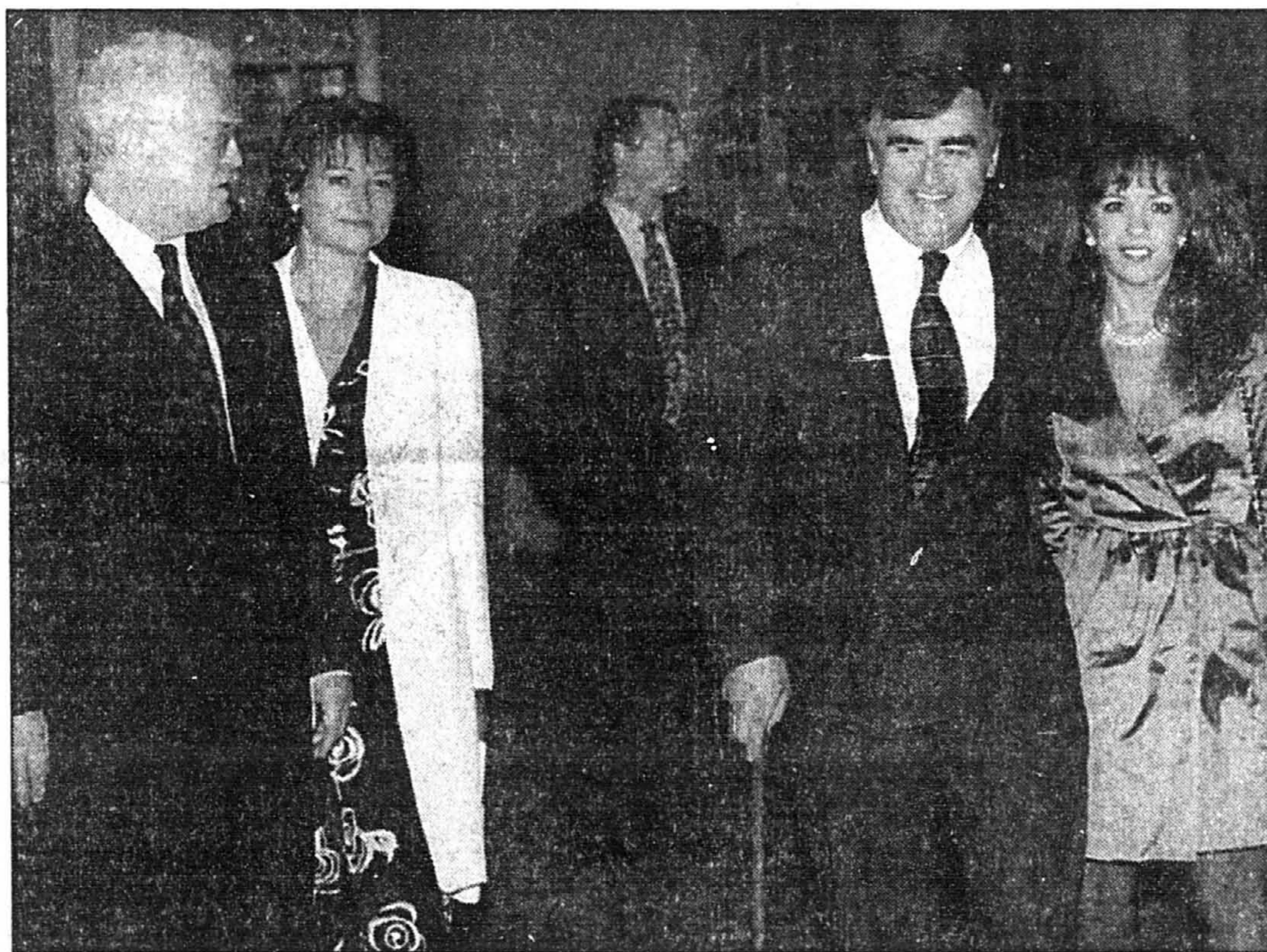
Le premier ministre de la France, Lionel Jospin (à gauche) et sa femme, Sylviane, ont accueilli hier à Paris le premier ministre du Québec, Lucien Bouchard, et sa femme, Audrey.