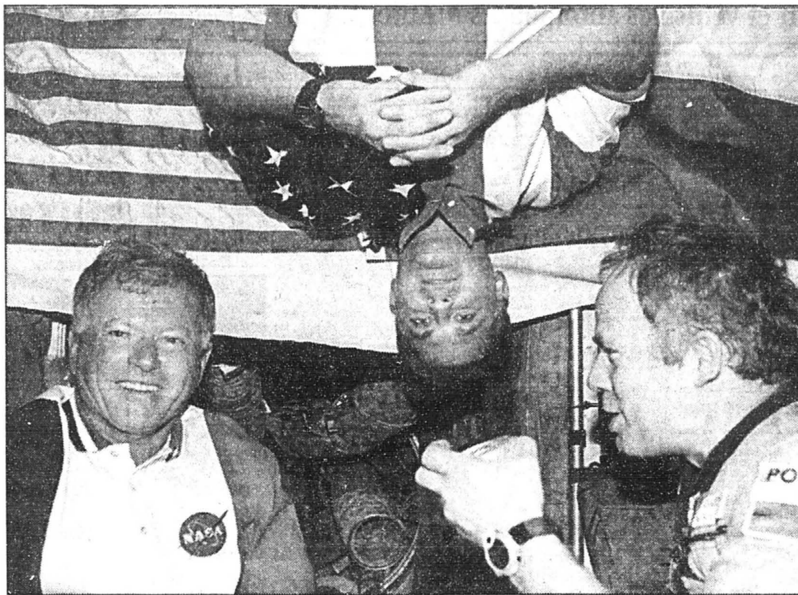
Peu après l'ouverture de l'écoutille entre la station spatiale russe Mir et la navette américaine Atlantis , les membres des deux équipages représentant trois pays (la Russie, la France et les États-Unis), ont été réunis dans le module au centre de Mir , le samedi 27 septembre. De gauche à droite on voit Jean-Loup Chrétien, spécialiste de mission représentant l'agence spatiale française; David A. Wolf, spécialiste de mission et bientôt cosmonaute et chercheur invité à bord de Mir ; et Anatoly Y. Solovoyev, commandant de la mission Mir-24 . Cette photographie a été captée par une caméra électronique.