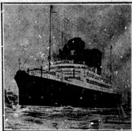
Le nouveau navire "Andonia".

LIVERPOOL, 8 rue Water, 1 rue Runford LONDRES, 51 Bishopgate, E.C. 20 Cockspur St. S.W. PARIS, 37 Boul. des Capucins.