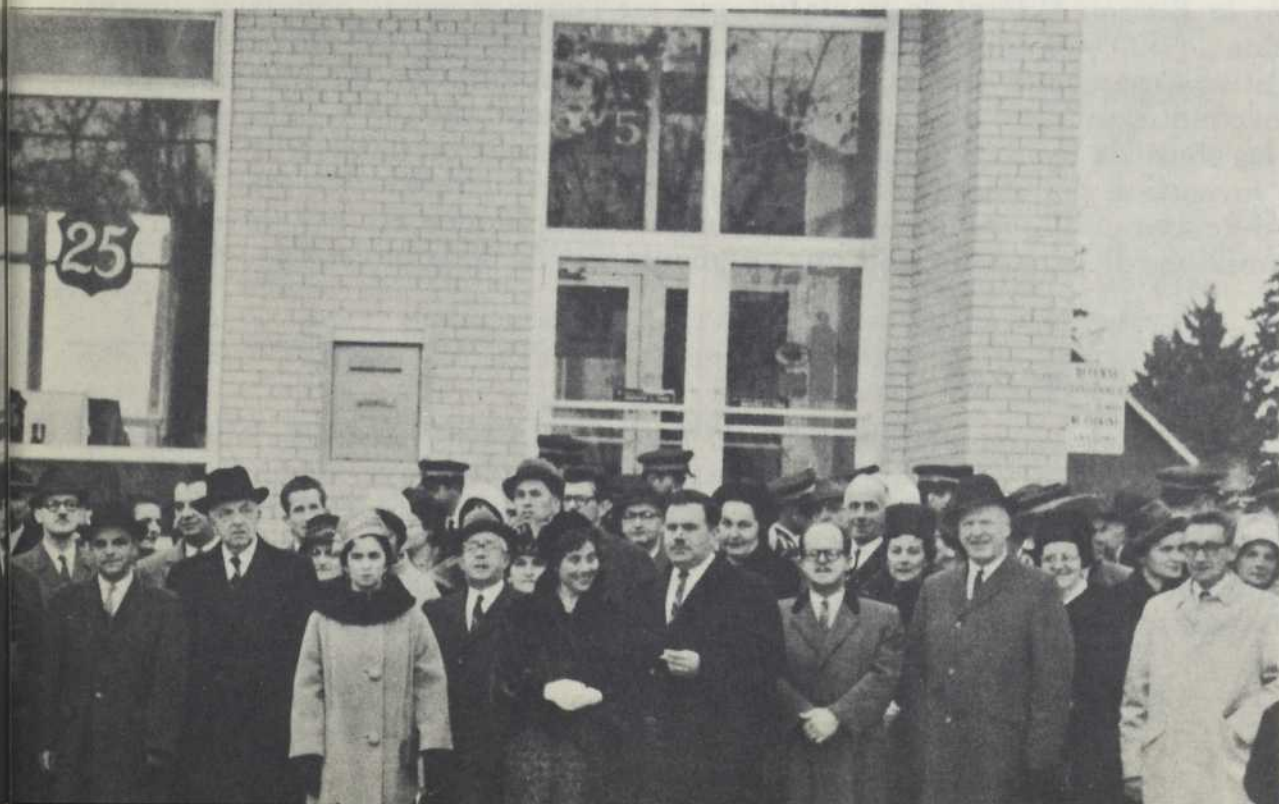
Photo prise lors de la réception, qui eut lieu à la Caisse populaire de Loretteville, à l'occasion du 25 e anniversaire. Cette fête restera mémorable dans les archives locales, et fut une réussite complète. Cette photo-souvenir en est la plus belle preuve.