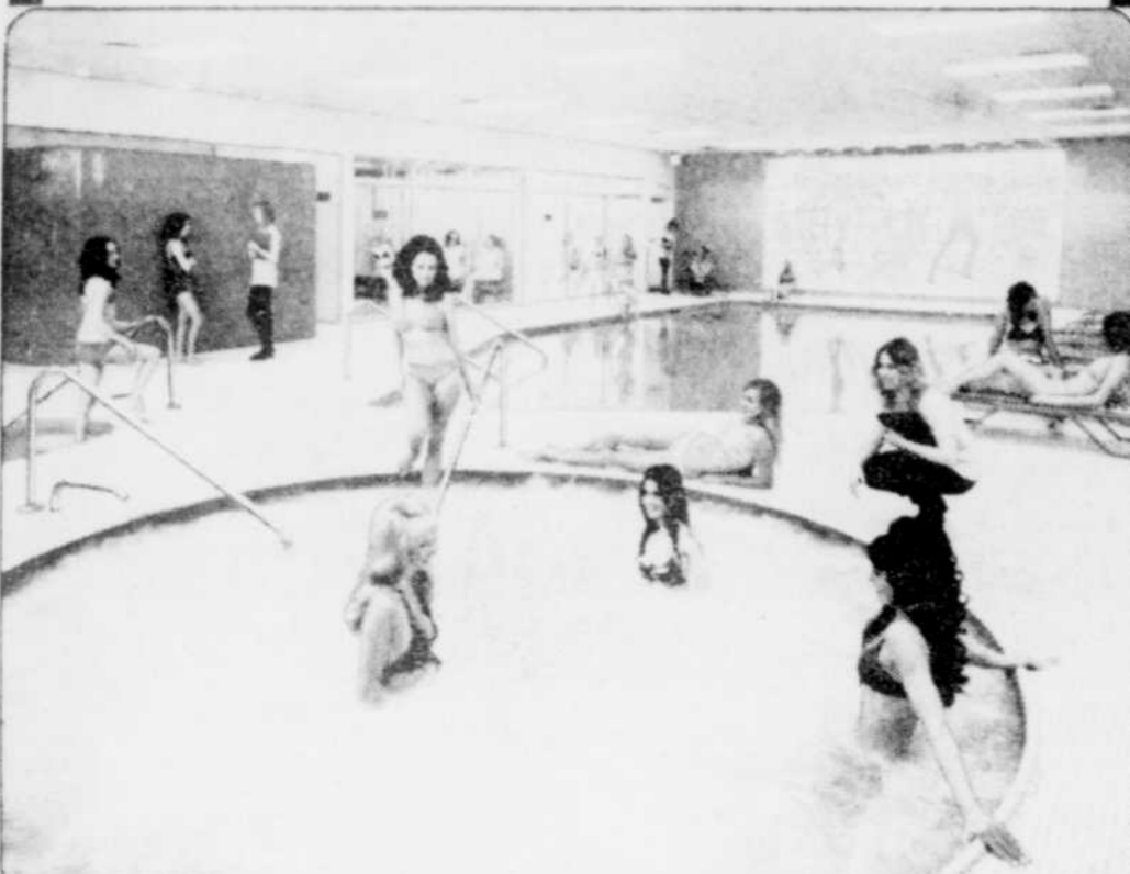
Vous vous détendez dans une piscine tourbillonnante, le bain sauna et les chambres de soleil.

On se sent bien dans sa peau grâce à Silhouette QUI VOUS REMETTRA EN FORME QUEL QUE SOIT VOTRE ÂGE