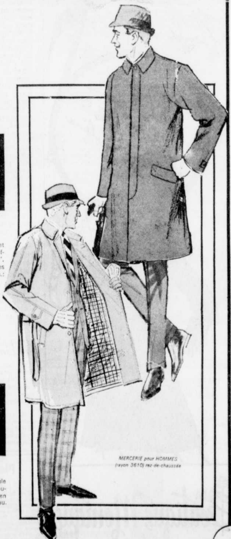
MERCERIE pour HOMMES (rayon 3610) nez-de-chaussée

Jeune, très élégant, le manteau-imperméable est ceinturé, plein d'allure avec son seul bouton apparent. Notre modèle est réalisé en fortrel et coton, durable, résistant à l'eau. Couleurs: marine ou blanc. Grs: 34 à 42.