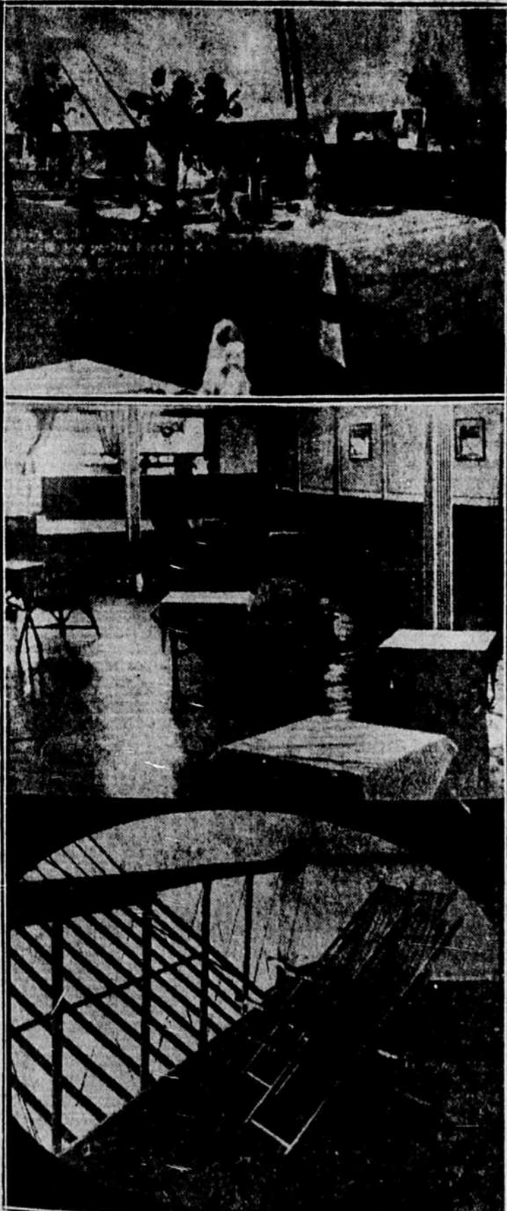
Quelques vues intérieures de dirigeable anglais "R-101" dont la première randonnée vient de se terminer par une terrible catastrophe. — En haut, la salle à manger; au centre, le salon, et, en bas, une promenade.