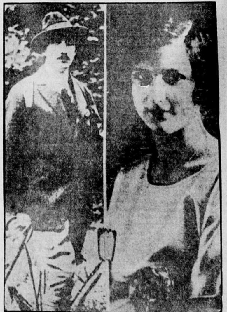
Les fiancailles du roi BORIS de bulgarie à la princesse GIOVANNA, fille du roi Victor-Emmanuel d'Italie, ont été annoncées officiellement vendredi soir, à Rome, par les souverains d'Italie. Le roi Boris est âgé de 36 ans et il régné sur son pays depuis le 3 octobre 1918. La princesse Giovanna est née le 13 novembre 1907.