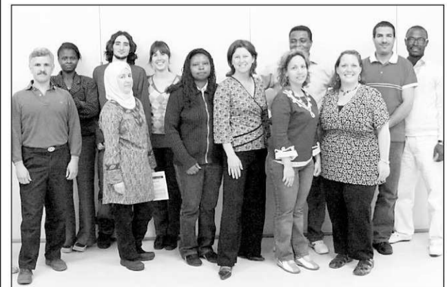
Les participants à la formation sur le Service à la clientèle Made in Québec , offerte par la CDEC.