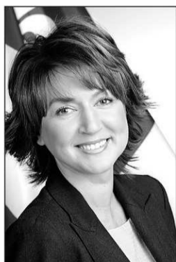
Nathalie Normandeau Ministre des Affaires municipales, des Régions et de l'Occupation du territoire

Depuis plus de 10 ans, la CDEC de Sherbrooke est un acteur dynamique et important pour le développement de l'économie sociale en Estrie. Son engagement dans le développement de l'entreprenariat collectif en fait un partenaire de choix dans la région. Sa contribution est significative et s'inscrit dans le Plan d'action gouvernemental pour l'entrepreneuriat collectif qui vise à accroître le dynamisme de nos régions.